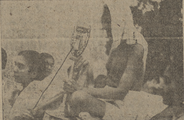
Gandhi, junto a su nieto predilecto, pronuncia el último discurso de su vida. "Foto" obtenida hace unos días en Nueva Delhi, en la reunión pública que el mahatma convocó para evitar la lucha entre el Pakistán y la India.

Reuter comunica de Nueva Delhi que el asesino de Gandhi ha sido identificado como Nataram Nihayak Gode, de treinta y seis años de edad. Es hindú y cabeceira de los "comunistas" hindúes, de tendencia extremista. -Efe.