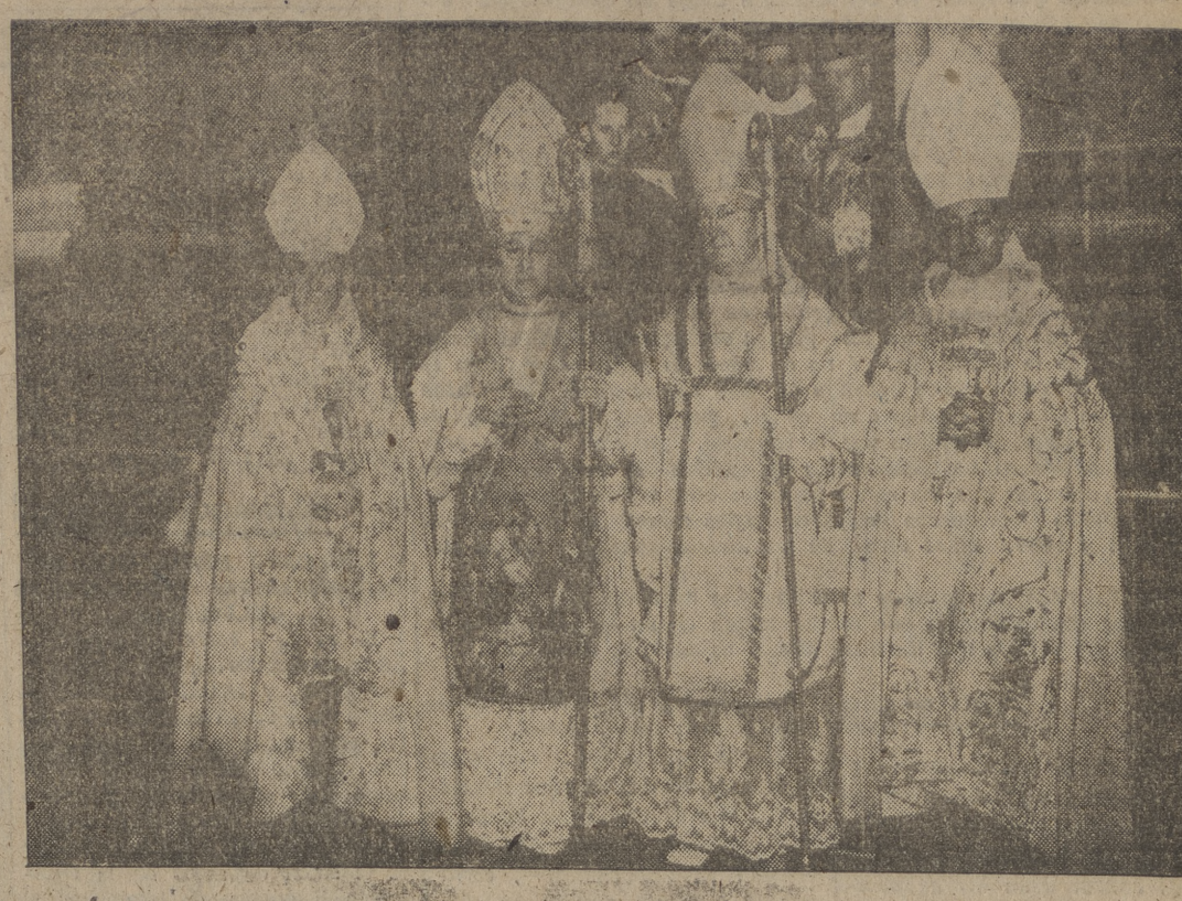
Con el tradicional ritual, se ha celebrado la solemne consagración del nuevo obispo de Washington, monseñor Patrick O'Boyle. La consagración la hizo monseñor Spellman, con quien aparece en la foto.

Multa de diez millones de pesetas a don José María Blanco Figueira, en su doble concepto de gerente del Consorcio Panadero e industrial fabricante de pan, cierre definitivo de todos sus establecimientos en industrias del ramo e incapacidad total y vitalicia para el ejercicio de cualquier actividad relacionada con esta clase de negocios.