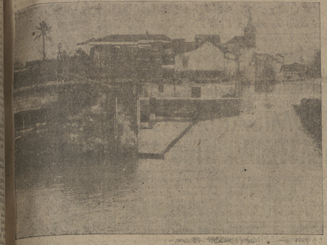
El río Guadalquivir ha inundado durante unos días la bella capital andaluza, ocasionando importantes daños. He aquí la calle Oriente, uno de los puntos más altos de Sevilla, cubierta por las aguas. (Foto CIFRA).

SEVILLA, INUNDADA PANADEROS SANCIONADOS LAS MULTAS ASCIENDEN a 29 MILLONES de pesetas