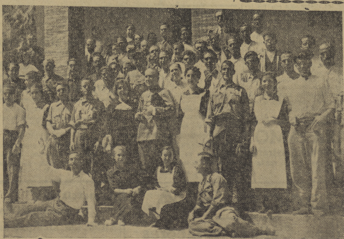
Soldaditos y damas malagueñas que los cuidan, con los "testigos" de la "prueba práctica" de nuestro relato.