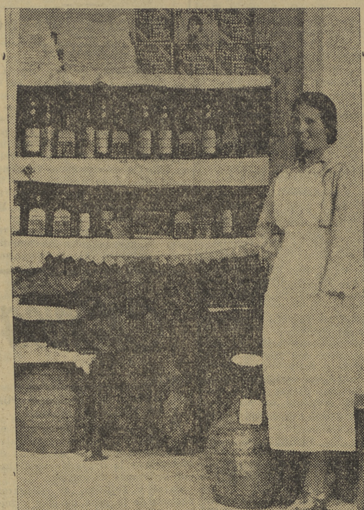
He aquí, en la situación de la despensa, la prueba más elocuente de cómo se cuida a los soldaditos en el Hospital.

son la España bendecida que hoy renueva su historia, nueva senda azul de vida elevada y presidida por la grandeza imperial."