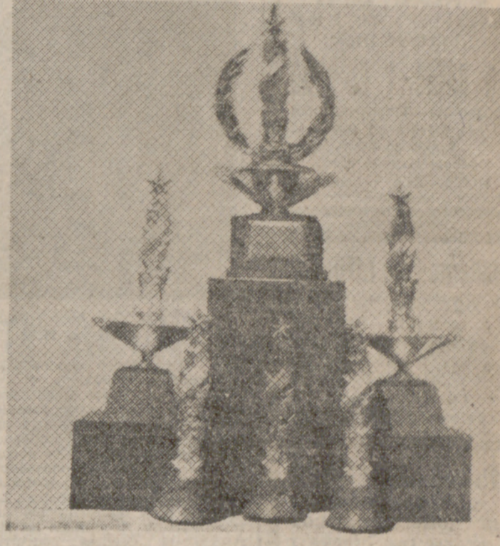
Trofeos entregados a los artistas galaronados.

—¿Galaronados en dioramas? —En esta especialidad, y por ter-