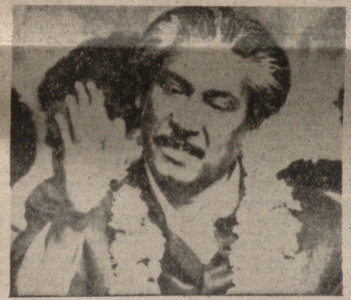
DACCA.—Sheikh Mujibur Rahman corresponde a los saludos de los miles de personas que acudieron a recibirle a su llegada a Dacca, tras nueve meses de encarcelamiento en Pakistán occidental.

Ya hay diez aspirantes a la Presidencia USA