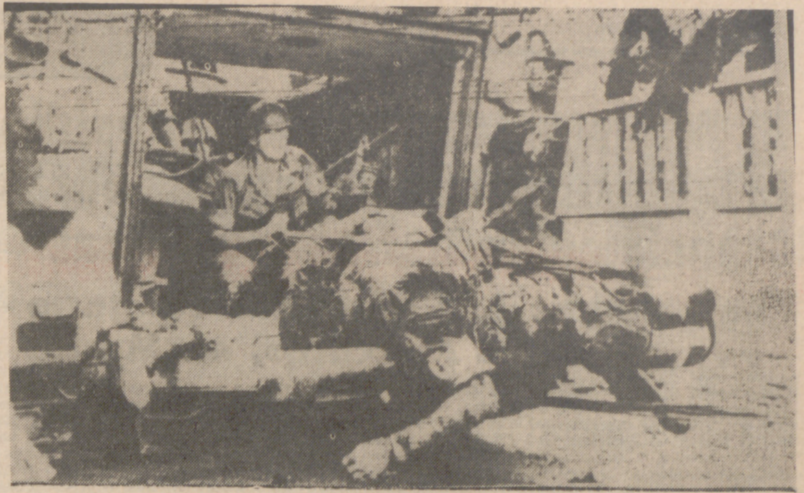
SAIGON.—Un camión blindado norteamericano patrulla lentamente por una calle de esta capital llevando en su parte trasera los cadáveres de algunos soldados norteamericanos muertos.

JOHNSON: «ESTAMOS PREPARADOS PARA HABLAR DE PAZ»