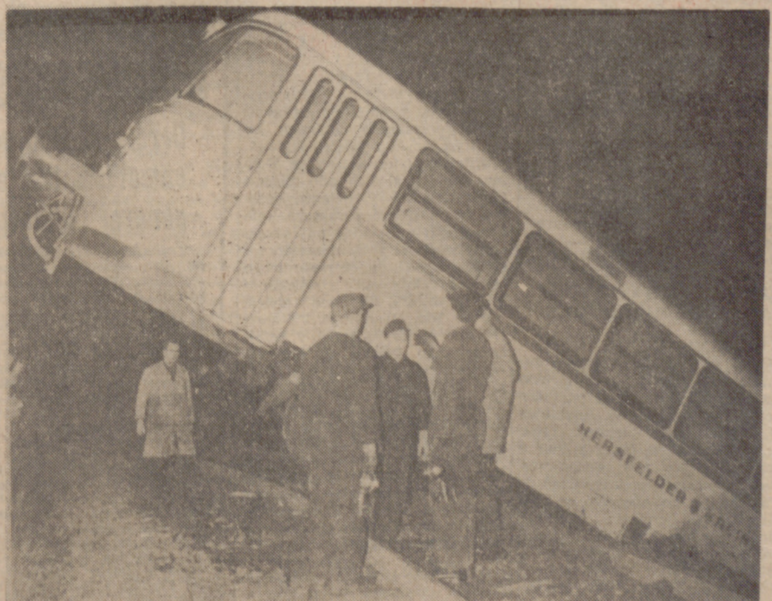
BAD HERSFELD (Alemania).—He aquí el automotor que descarriló y se precipitó sobre una pendiente a causa de las piedras colocadas durante sus juegos por unos niños sobre los raíles. Dos de los doce pasajeros resultaron heridos.