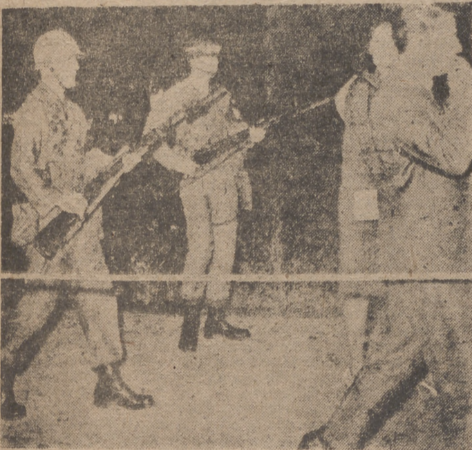
En Berlín, frente al pueblo enfurecido, por primera vez, desde después de la guerra, salieron a relucir las bayonetas norteamericanas contra los manifestantes occidentales. Dirección equivocada de esos fusiles. Se comprende que la Europa del milagro viva todavía, por eso: del milagro.