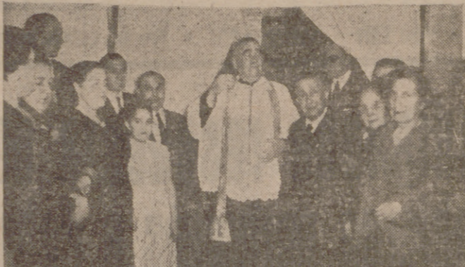
Un momento de la penitencia. - (Foto Ca. v. a.).