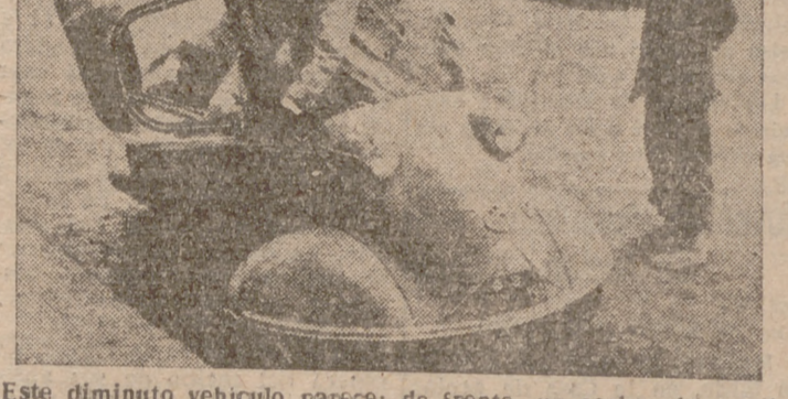
Este diminuto vehículo parece: de frente, un coche; de perfil, un triciclo; por detrás, una moto, y de alguna manera, un avión microscópico. Tiene tres ruedas, circula estos días por Madrid y cada uno puede bautizarlo a su gusto.

PARA TODOS LOS GUSTOS El cuerpo de voluntarios para Goa ha sido reconocido oficialmente