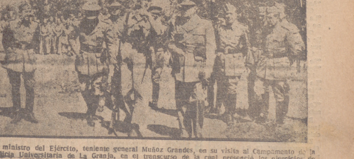
El ministro del Ejército, teniente general Muñoz Grandes, en su visita al Campamento de la Milicia Universitaria de La Granja, en el transcurso de la cual presenció los ejercicios de unas prácticas militares y pronunció un importante discurso.