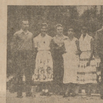
La clase ha terminado. Y los alumnos "posan" para el objetivo de Carvajal.

Mañana y tarde, el patio de la Casa de Santa Cruz ofrece ese coloquio sosegado, en el transcurso del cual se habla de los clásicos españoles y de las ciudades de Europa. Y se habla en castellano, pese a que en alguna que otra ocasión el acento del alumno detate su nacionalidad.