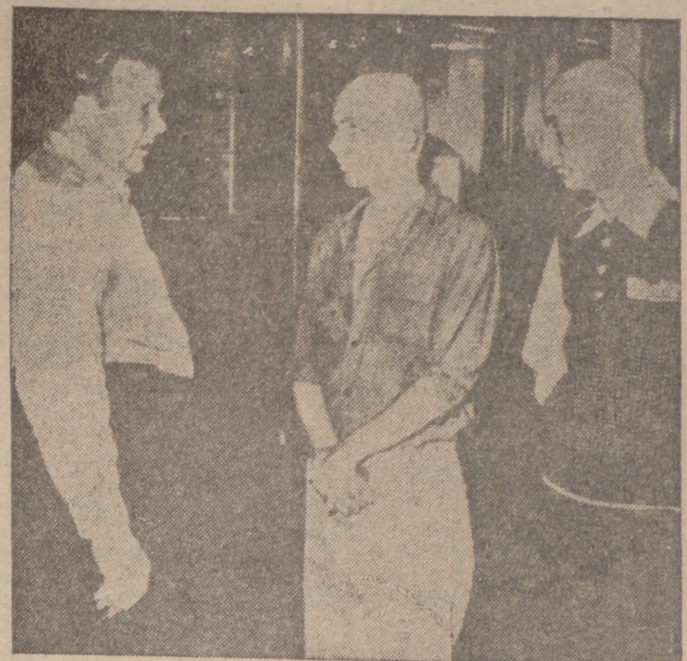
El conocido y temido castigo de aplicar la máquina del cero a la cabeza ha sido administrado en Michigan a estos dos muchachitos americanos, a los que aún se les ha afeitado luego para completar el castigo por sus abundantes pillerías.