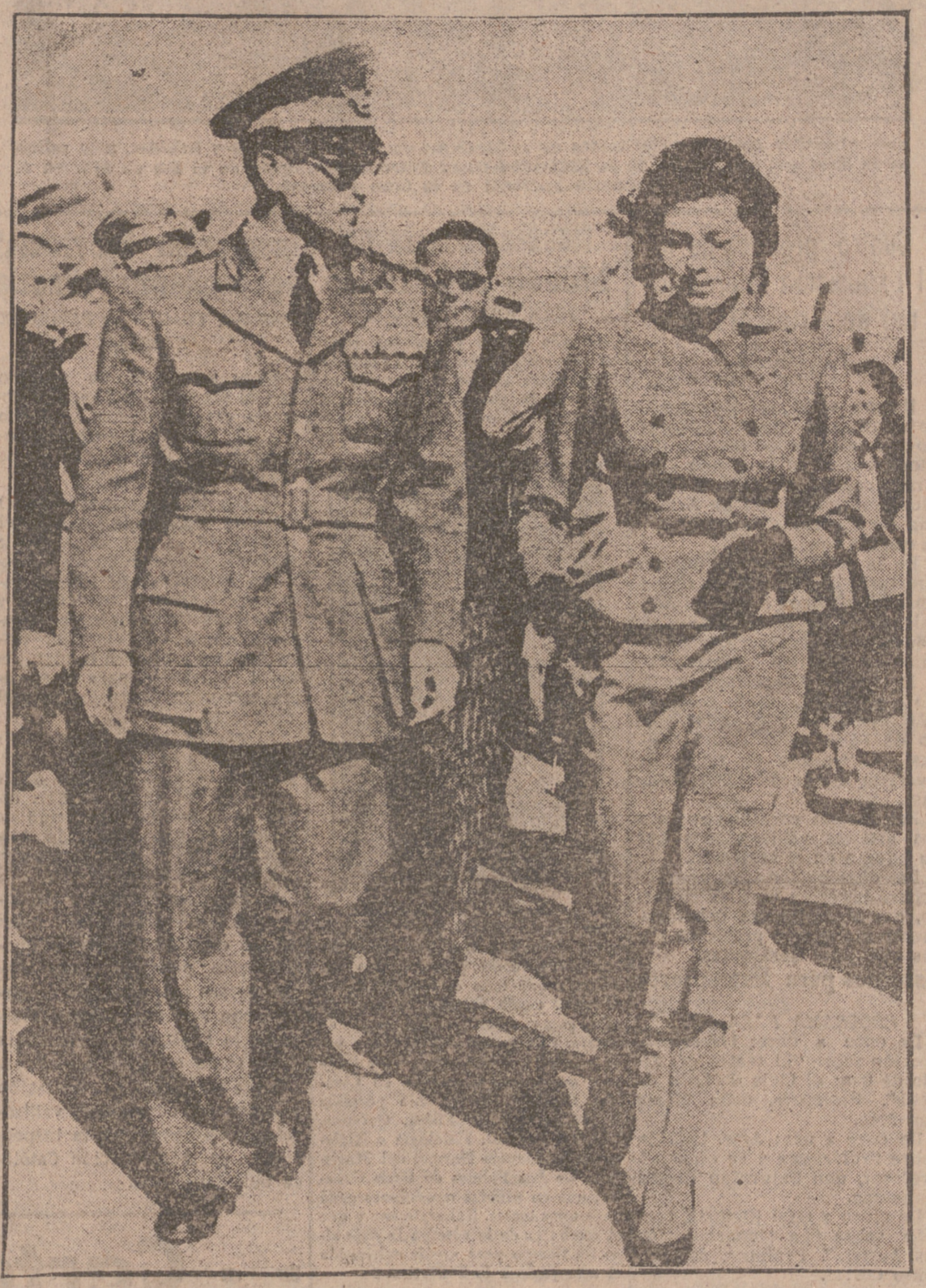
Mohamed Reza Pahlevi, Sha de Persia, con su esposa, la bella reina Soraya, a la que acudió a recibir al aeródromo de Teherán. Soraya volvió al real hogar el pasado día 6, procedente de Roma, donde pasó una temporada coincidente con la convulsión política por que atravesó el Irán. Restablecido el orden, la reina ha regresado a casa.