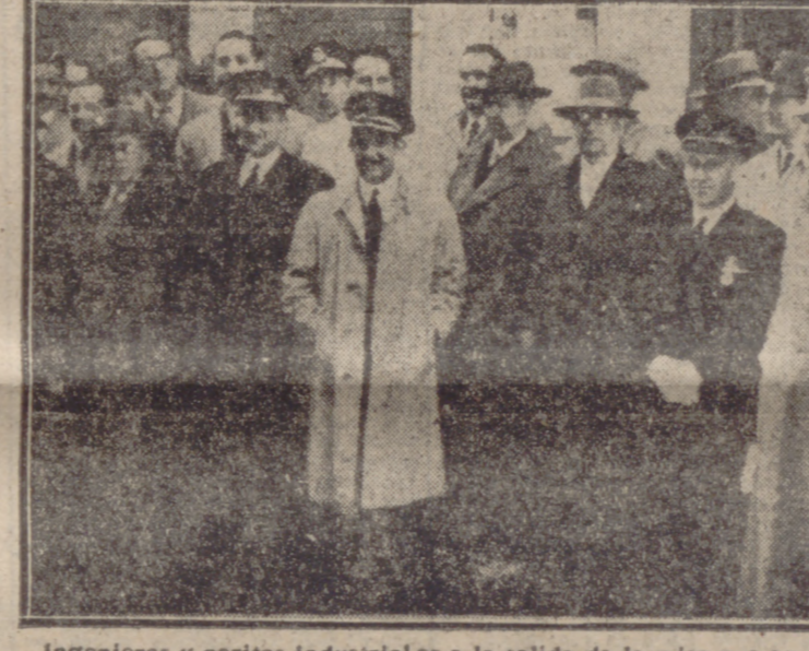
Ingenieros y peritos industriales se a la salida de la misa que en honor de su Patrón, San José, celebraron ayer en la iglesia de Jesús Nazareno

Ayer los Ingenieros y peritos industriales celebraron diversos actos en honor de su Patrón, San José.