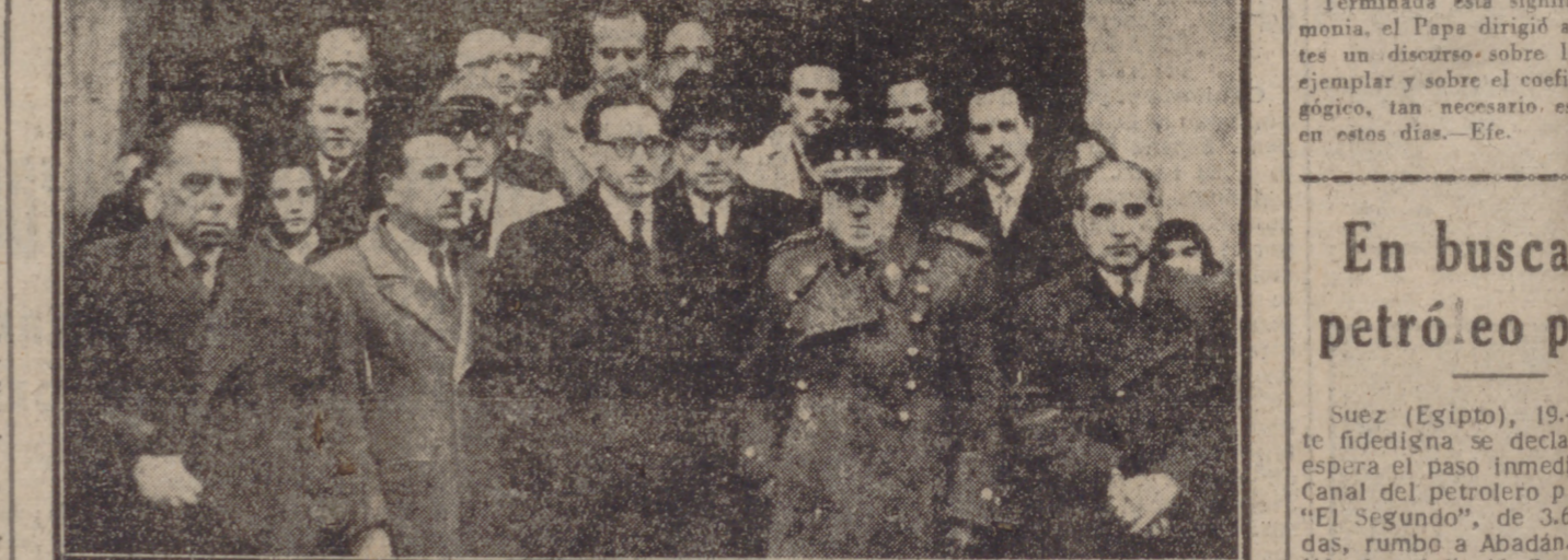
El delegado de Trabajo y autoridades a la salida de la misa celebrada ayer en el Santuario Nacional para conmemorar la festividad de San José, Patrono del Ministerio de Trabajo.

En la Casa Sindical se efectuó la entrega de premios a la natalidad