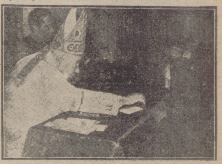
El Prelado imponiendo la medalla a la madre de un sacerdote.

Al final, los seminaristas interpretaron el guión radiofónico "Camino de Paz"