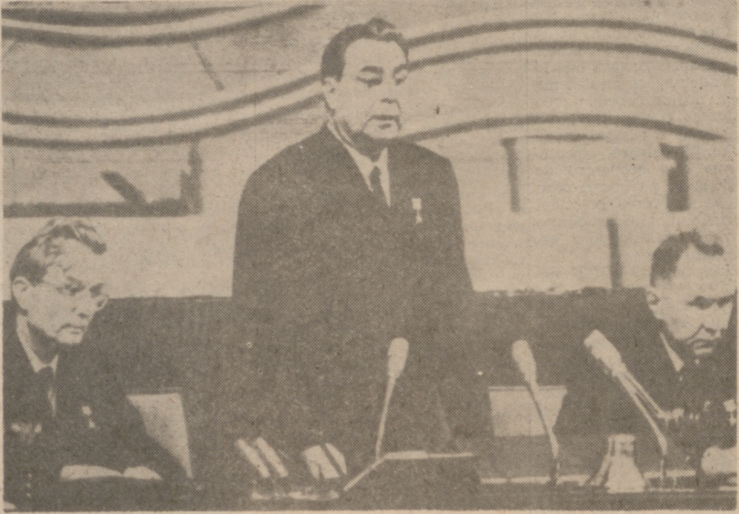
Breznev, acompañado de Kosygin y Suslov, exponiendo al XXIII Congreso Comunista ruso las razones que les separan de los chinos.

En el mismo asunto del Vietnam, la evolución violenta del proceder chino está en sentido totalmente opuesto al sistema ruso actual. En la declaración del XXIII Congreso Comunista de Moscú dijeron los rusos: "Tenemos pruebas para afirmar que uno de los objetivos de la política de los dirigentes chinos por lo que respecta al problema del Vietnam es el de provocar un conflicto militar entre la URSS y los Estados Unidos. Quieren que la URSS choque