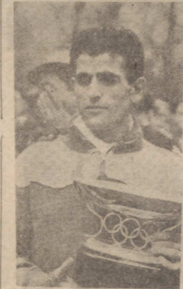
Como los anticipamos, se celebró en Santander el IV Cross Año Nuevo que organiza nuestro colega en la capital cántabra...