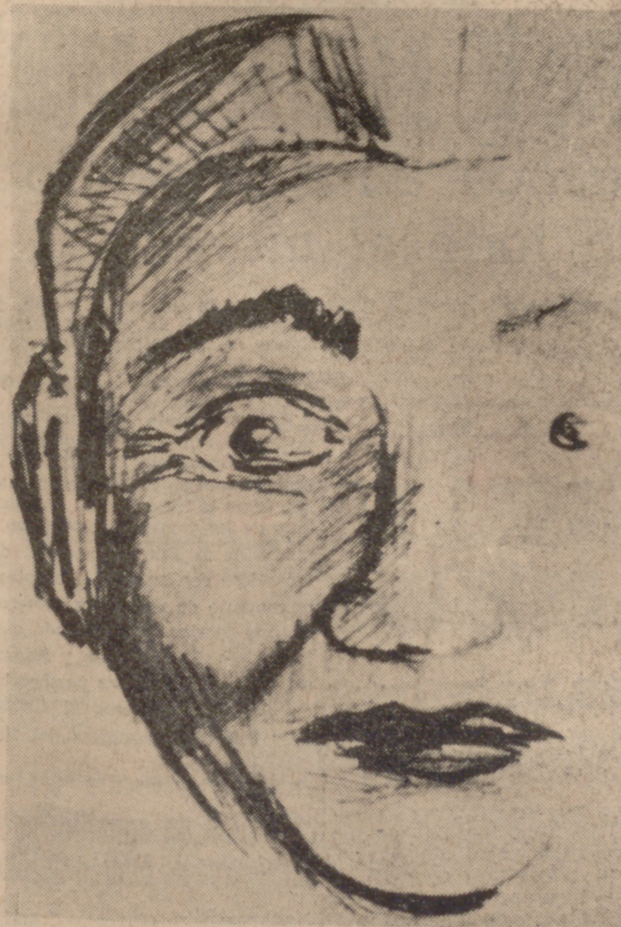
MADRID.—Foto-robot del asesino de Mohamed Jidder, facilitada por la Policía española.

Foto-robot del asesino de Mohamed Jidder