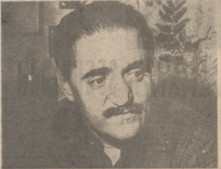
Lauro Olmo, autor de teatro y escritor.

«¿Cada vez es la función fundamental del teatro?»