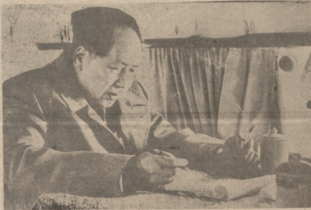
Mao, pensativo, tiene delante de él un memorándum que dirigió en violenta protesta a los rusos.

re, porque están convencidos que no todo el monte es orégano, y aunque los chinos llaman a Estados Unidos "tigre de papel", este tigre tiene dientes atómicos.