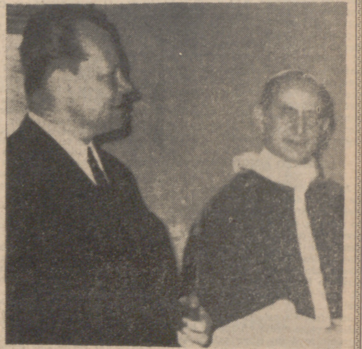
CIUDAD DEL VATICANO. — El vicerecanciller de la República Federal Alemana, Willy Brandt, durante la audiencia que le concedió S. S. el Papa Pablo VI en el Palacio Apostólico.