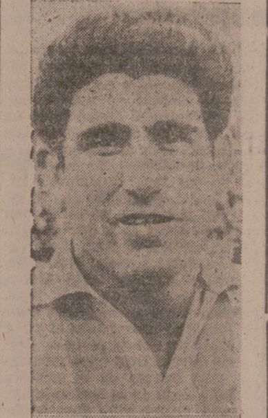
Matito, uno de los mejores frentes al Elche.

El arbitraje del señor Rey fue bueno, ayudándole unos y otros con sus gratos modos, que si al lector le pudieron parecer rotos con