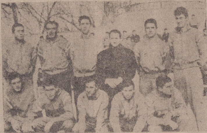
El equipo del A. A. La Salle, vencedor ayer en las Piscinas.

fallos lasalianos y alternativas en las anotaciones prosigue el juego y una breve reacción final permite al bando vencedor colocarse con la diferencia final de 35-48. Ya hemos señalado que no nos convenció el Aguilas, pero también se justo reseñar que sus muchachos, excesivamente jóvenes en todos ellos, demostraron parar buenas cualidades para triunfar. Defendieron la zona con cierta efectividad, favorecidos por la machaconería del adversario, obstinado en no mover la pe-