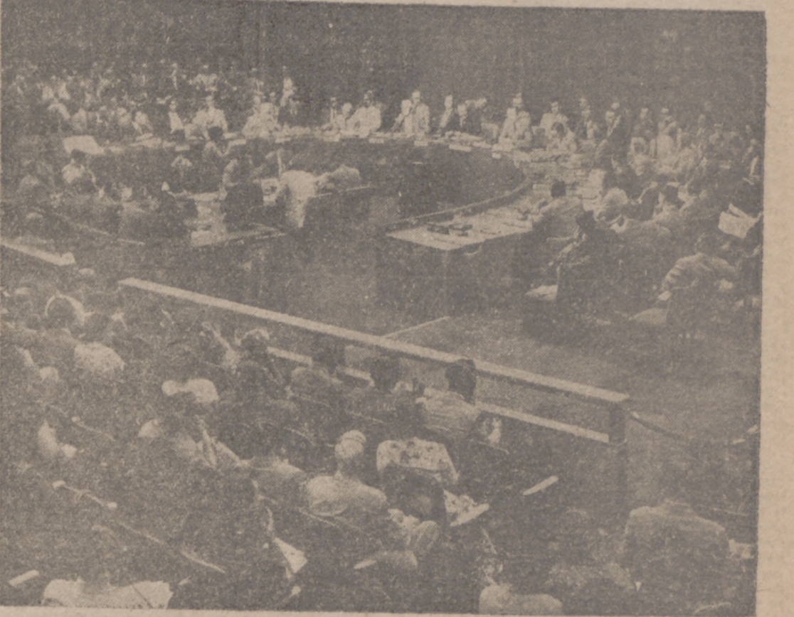
Reunión del Consejo de Seguridad en la que se dió el orden de cese de hostilidades, sin el menor resultado, ya que las fuerzas comunistas, como enjambres de diablos rojos, continúan lanzándose sobre las líneas aliadas.