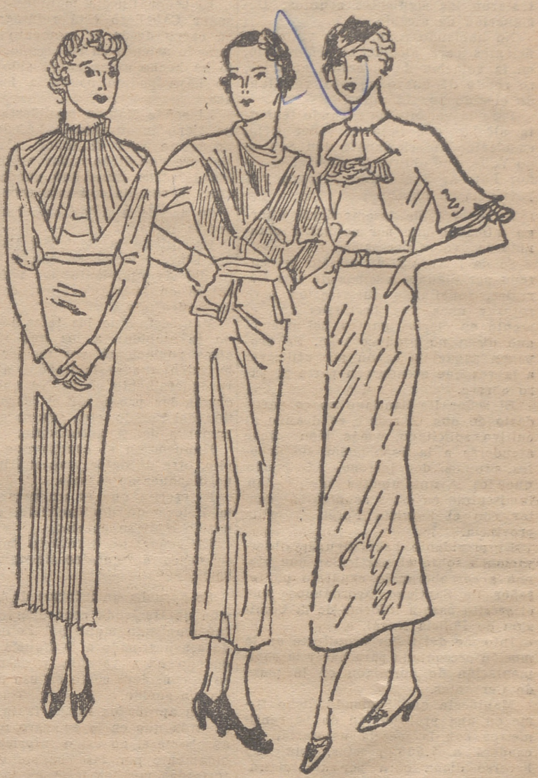
Elegantes y prácticos camisones de crepón

Nadie puede vivir siempre contra sus deseos. Cuanto más se trate de sacar al hom-