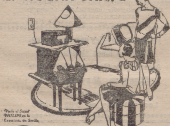
Visite el Stand PHILIPS en la Exposición de Sevilla.

Haga su hogar grato a sus amistades e invitados mediante el RECEPTOR PHILIPS DE LUJO, CON EMPUJE A LA LUZ Y CON ALTAVOZ ELECTRODINAMICO : la música y el canto reproducidos a la perfección, a través de un aparato que por su aspecto hermoso es el mejor adorno de una habitación.