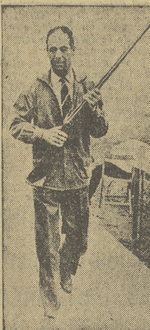
Nuevamente el conde de Teba, cuyas actuaciones en los Campeonatos del Mundo no fueron tan brillantes como de costumbre, acaba de proclamarse campeón de España en las pruebas de tiro al pichón de Gudamendi, ante 83 escopetas.