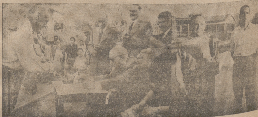
Nuestro "reporter" Villafranca, que fué ayer a las finales del torneo de bolos, trae para los lectores esta estampa jubilosa que anuncia la presencia del general Yagüe en este campeonato, celebrado sobre el suelo de su obra gigantesca. Con el "Trofeo General Yagüe", la pareja vencedora