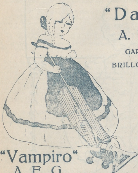
"Vampiro" A. E. G.