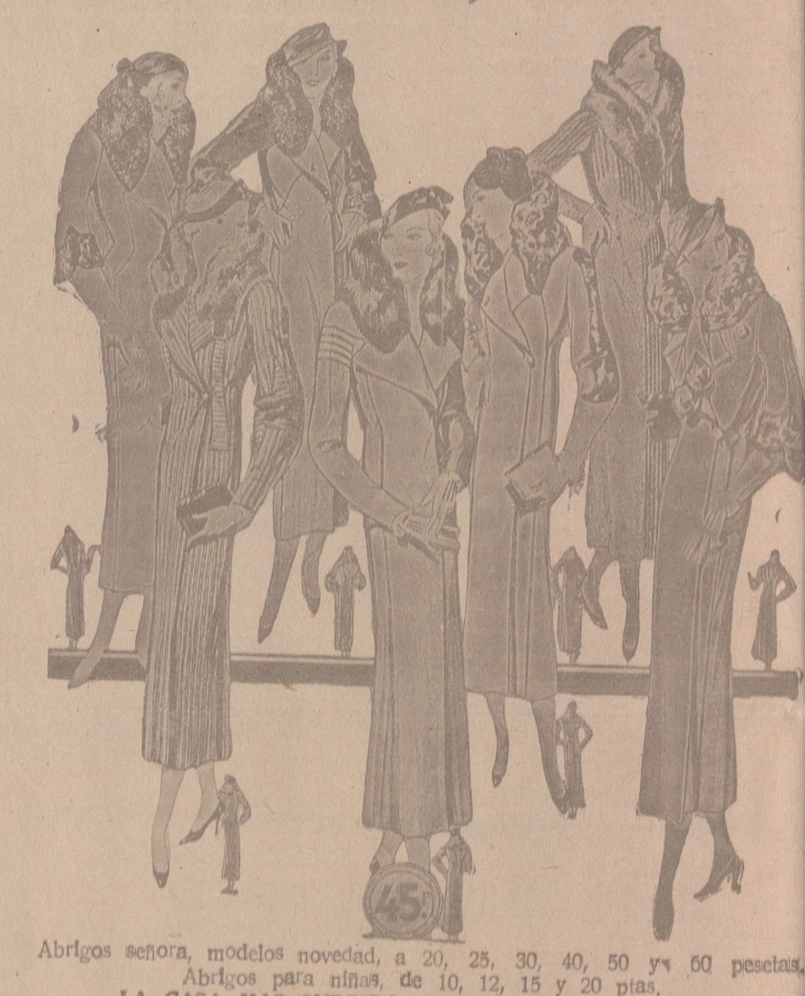
Abrigos señora, modelos novedad, a 20, 25, 30, 40, 50 y 60 pesetas. Abrigos para niñas, de 10, 12, 15 y 20 ptas. LA CASA MAS SURTIDA Y MAS BARATO VENDE

Casa Munguía Plaza Mayor, 48 y Lain Calvo Sucursal: Plaza Mayor 5 BURGOS Primera casa en confecciones para caballero, señora, jóvenes y niños. Tejidos, Pañería y Sastrería