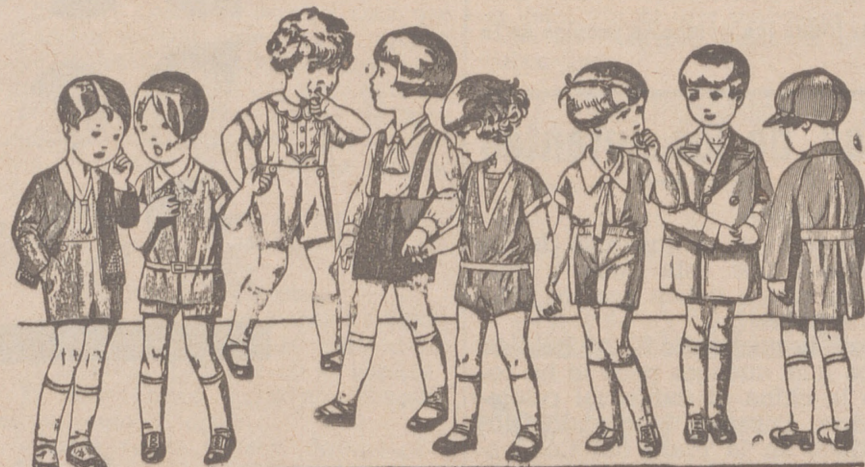
Diversidad de modelos en trajectos para niños en punto, dril, lana o pana, de 5 a 15 ptas.

Plaza Mayor, 48 y Lain Calvo, 9 Sucursal: Plaza Mayor 5 BURGOS Primera casa en confecciones para caballero, señora, jóvenes y niños Tejidos, Pañería y Sastrería