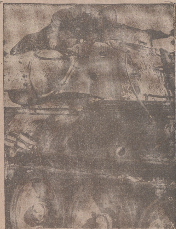
Las tropas alemanas han iniciado un contraataque contra las líneas bolcheviques. En todos los sitios hay tanques enemigos del tipo T-34 puestos fuera de combate por las armas alemanas. También este coloso de acero fué víctima de ellas.