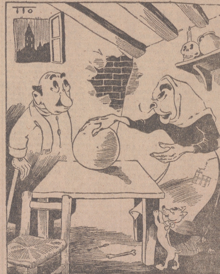
PITONISA, por ITO —¿Qué desea usted saber, caballero? ¿Si los negocios le irán bien?... si le va a tocar la lotería?... ¿si será pronto millonario? —No, señora. ¡¡¡Que cuándo van a dar el tabaco!!!