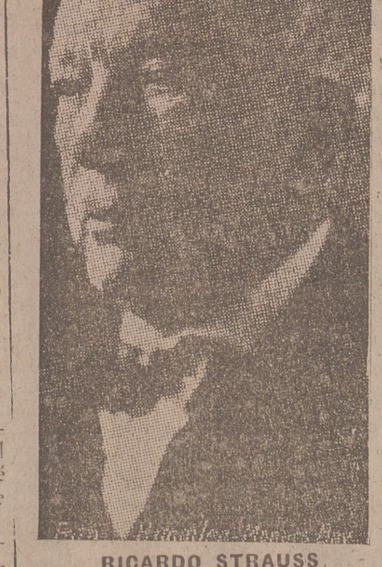
RICARDO STRAUSS El gran compositor alemán, que acaba de cumplir 75 años