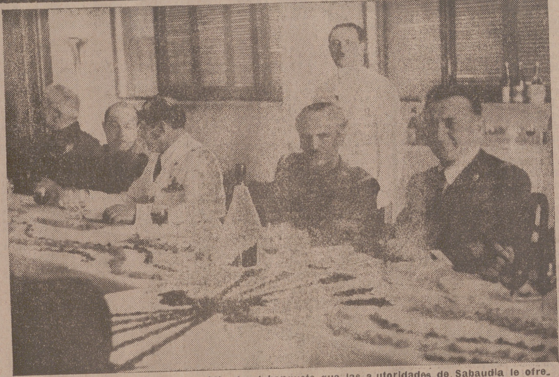
El ministro de la Gobernación presidiendo el banquete que las autoridades de Sabaudia le ofrecieron durante su visita al Agro Pontino