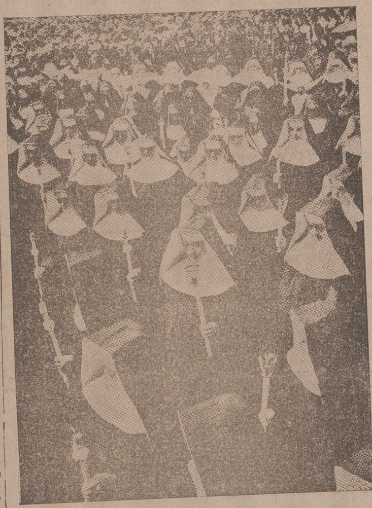
Un grupo de monjas en la procesión del "Corpus Christi" en Berlín

Nueva York, 13.—Los Reyes de Inglaterra, de regreso de los Estados Unidos, han vuelto al Canadá, de donde saldrán, si el estado del mar no lo impide, el día 15 de junio para Southampton. Quizá hayan de hacer un gran rodeo para evitar la zona que aún se encuentra obstaculizada por nieblas y témpanos de hielo.—(CSA).