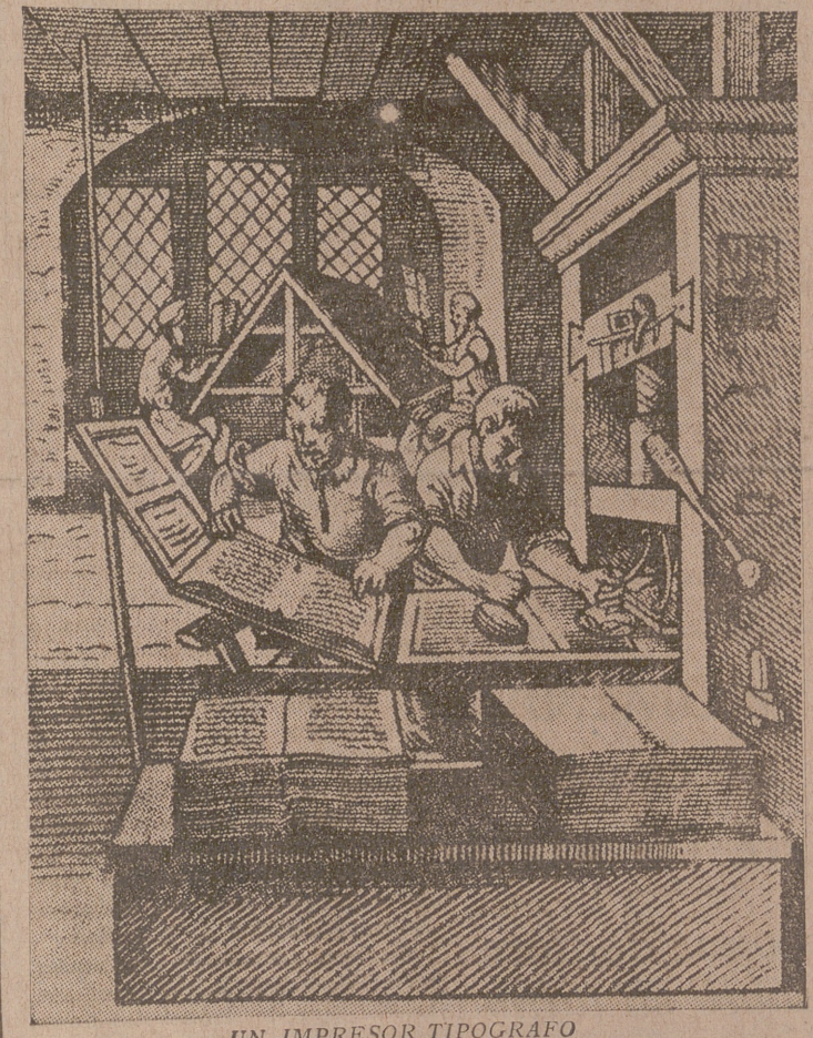
UN IMPRESOR TIPOGRAFICO

Este no era suficiente. La letra tan brillante y tan nítida de los manuscritos era necesario conseguirla. La falsificación todavía no era perfecta. Viendo que los caracteres de