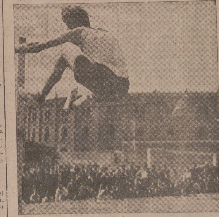
Lanzamiento de disco y salto de altura