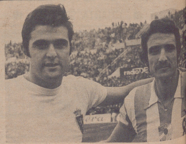
Aragonés y catalán, compañeros en el "Barça" y rivales ayer