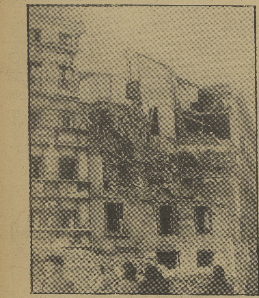
MADRID.—Casas destruidas por la aviación fascista en la Plaza de Anton Martín