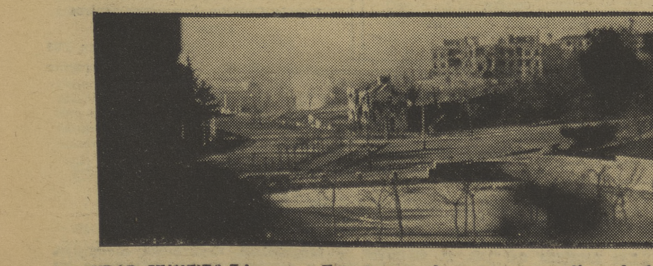
CIUDAD UNIVERSITARIA. — Foto tomada desde la primera línea de fuego de este frente madrileño. A la izquierda se ve la explosión de una granada

Se convoca a todos los militantes y simpatizantes alumnos de la Escuela de Guerra a la reunión que tendrá lugar hoy, viernes, a las seis de la tarde, en el local del P.O.U.M., de Sarriá (Plaza Sarriá, 20).