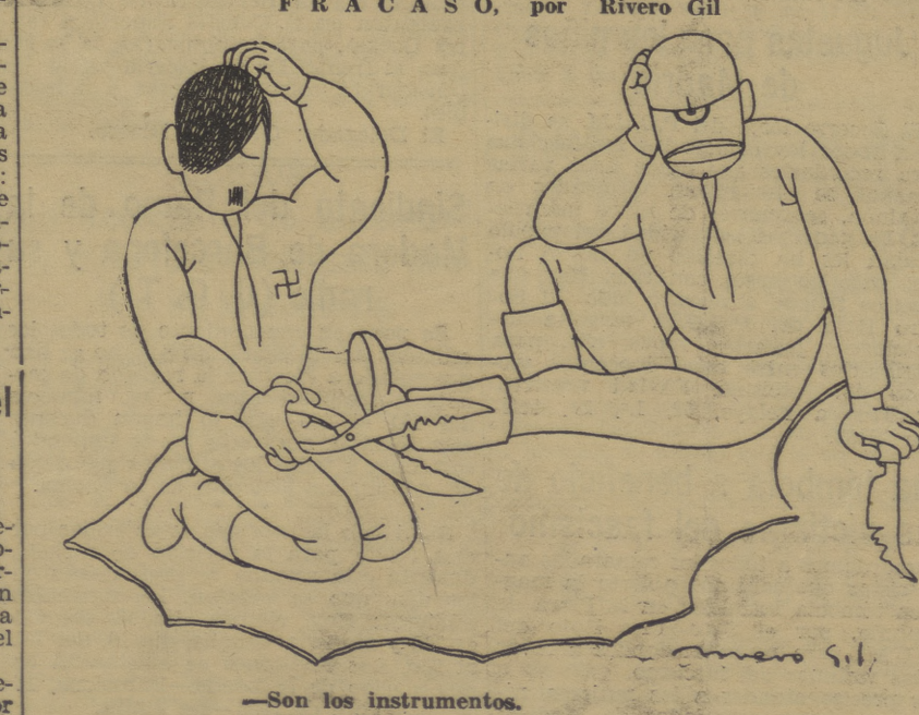
—Son los instrumentos. —Y la piel!