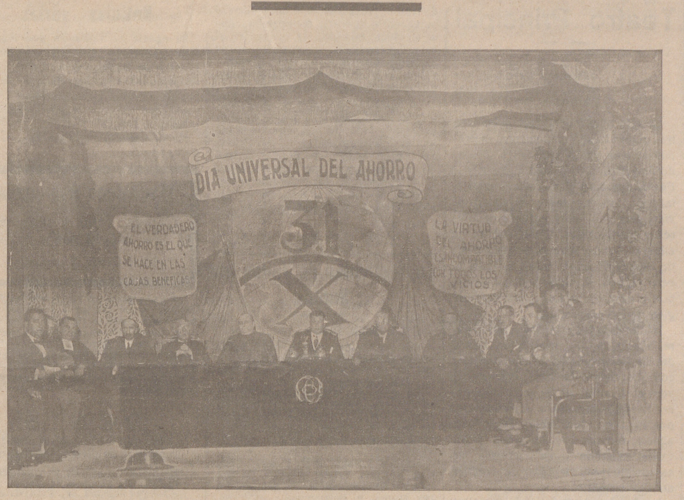
La presidencia durante el acto

Para conmemorar la fiesta oficial del Día del Ahorro, en cumplimiento de las Reales órdenes de 1.ª y 15 de octubre de 1925, la Caja de Ahorros y Monte de Piedad, celebró ayer una breve velada en la sede de la tarde, en el Salón-Teatro del Círculo Católico de Obreros. En el escenario se había preparado el estrado para la presidencia y había sido primorosamente decorada la escena. Al fondo sobre una gran estera, la fecha de 31 de octubre, dando a comprender que ese es el día universal del ahorro y a los lados, sobre dos banderolas, emblema de la Patria, dos cartelas con máximas adecuadas al acto que se celebra.