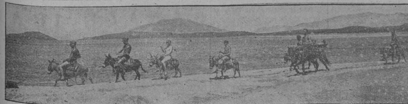
Alegre carrera de soldados alemanes de las Compañías de SS en el mar Jónico

En el Hotel Oliden comieron con el camarada Girón y las personalidades que le acompañaban, el Sr. Gobernador Civil y el Delegado Provincial de excombatientes. Después de comer se trasladaron todos al Puerto de Pajarres donde el Sr. Gobernador y el Delegado de Excombatientes despidieron al Sr. Ministro y sus acompañantes que siguieron viaje a Gijón.