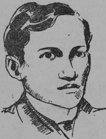
Josep P. Rizal.