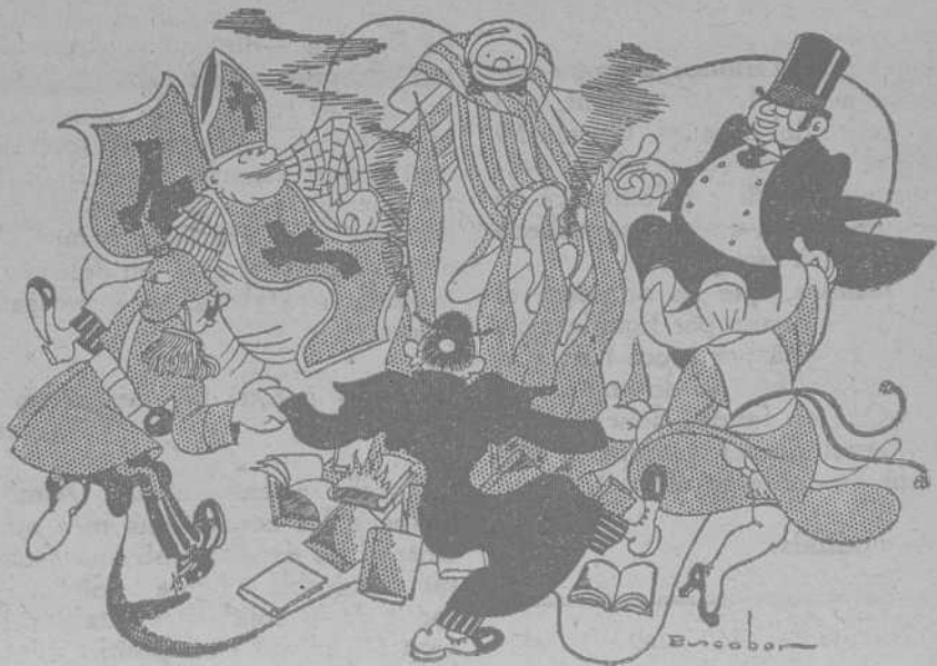
—Aquesta escalforeta reconforta!

A poc queia Rizal sota la descàrrega. Queia, però, de cara al sol,