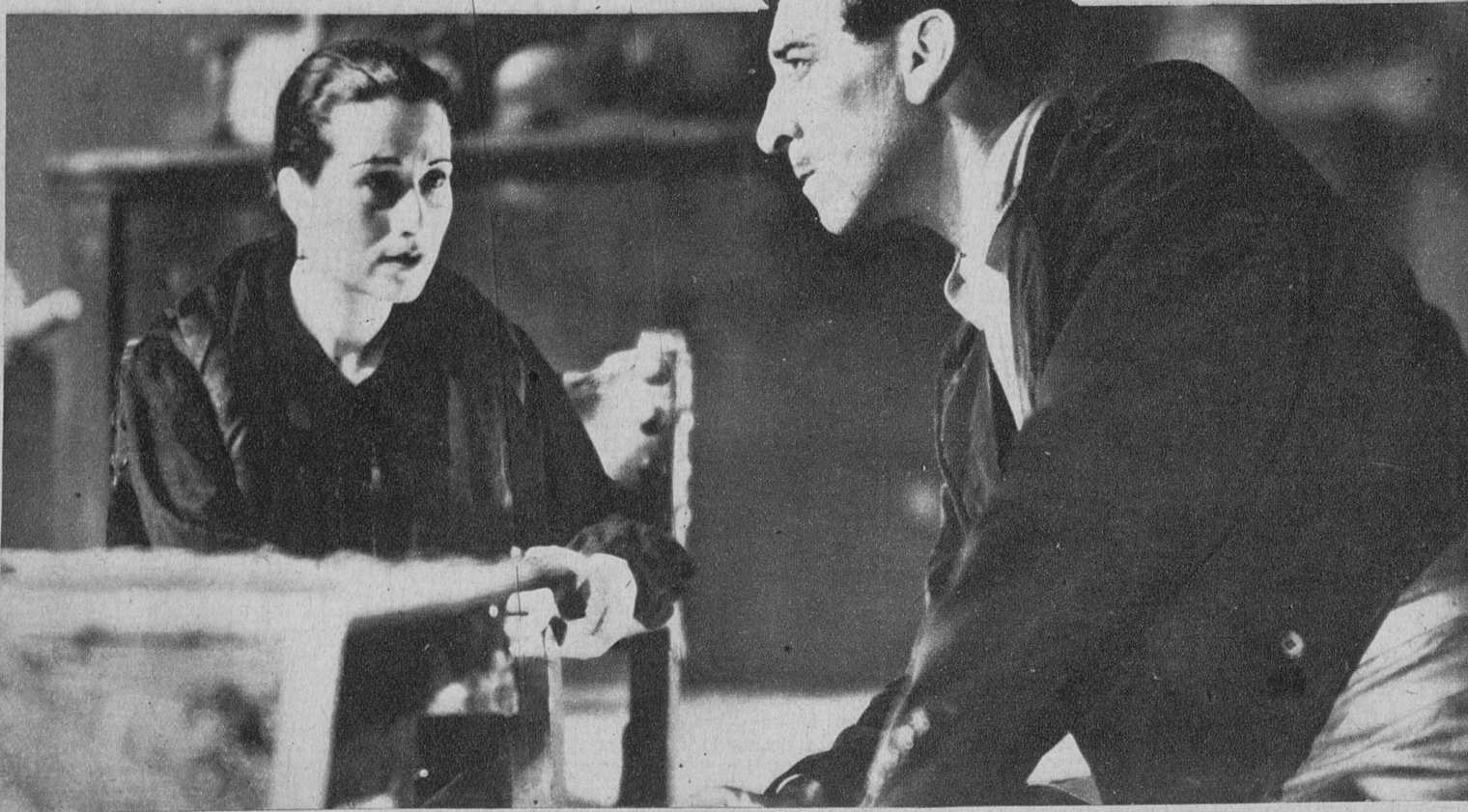
Marina Torres y Antonio Partago, destacadas figuras de la cinematografía nacional