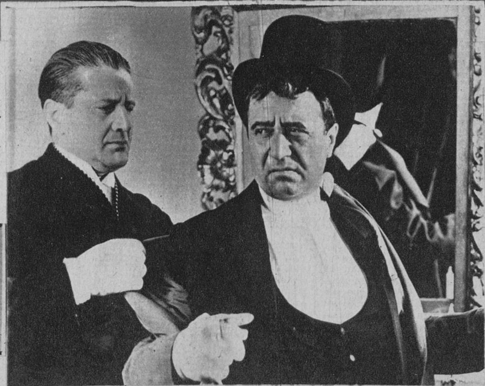
El gran actor cómico Raimu, en su nueva creación «Carlomagno»