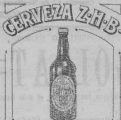
AGENTES PARA MARRUECOS CORIAT & CIA EN TANGER