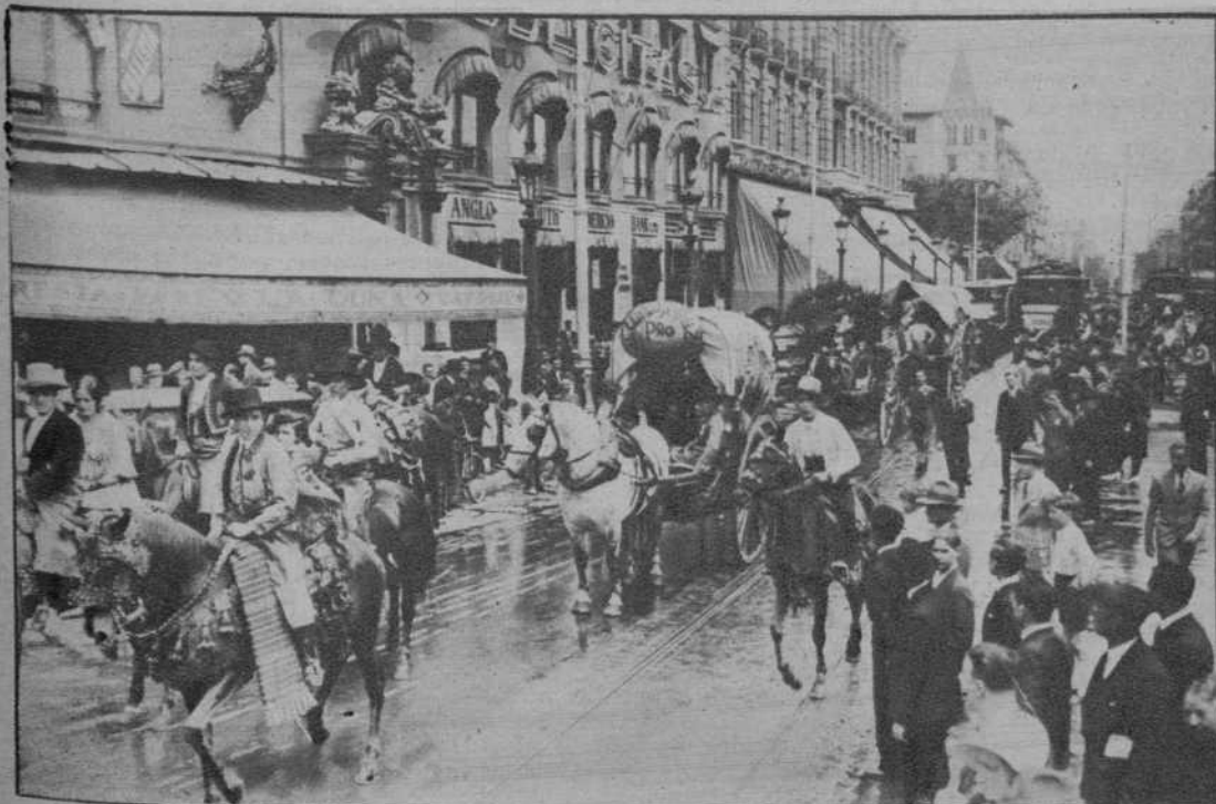
EL «CENTRO ANDALUZ» DE NUESTRA CIUDAD, ORGANIZÓ UNA TÍPICA CABALGATA, EL DOMINGO, QUE DESFILO BRILLANTEMENTE POR LAS CALLES BARCELONESAS, A BENEFICIO DE LOS HOSPITALES La cabalgata, desfilando por la Plaza de Cataluña, ante nuestra Redacción