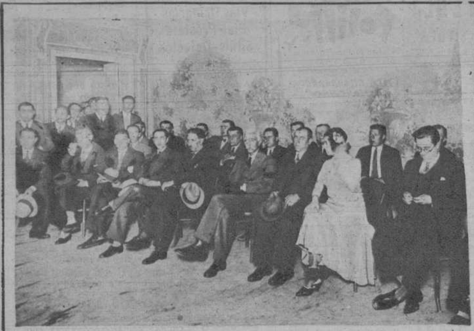
De la excursión por Cataluña realizada el domingo por el Presidente de la Generalidad, Don Francisco Maciá, en la presidencia del mitin celebrado en Torelló.