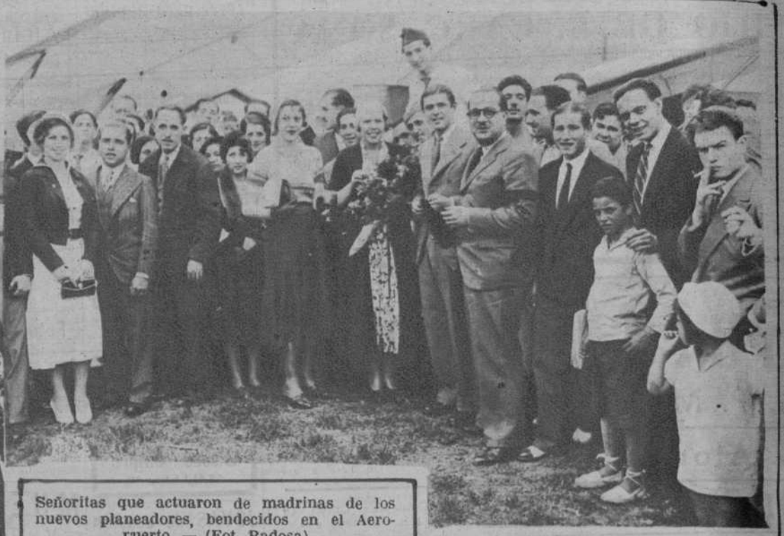
Señoritas que actuaron de madrinas de los nuevos planeadores, bendecidos en el Aeropuerto.