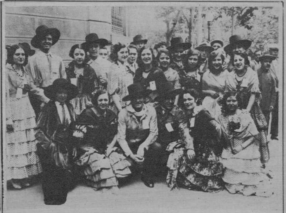
Distinguidos jóvenes que tomaron parte en la cabalgata.