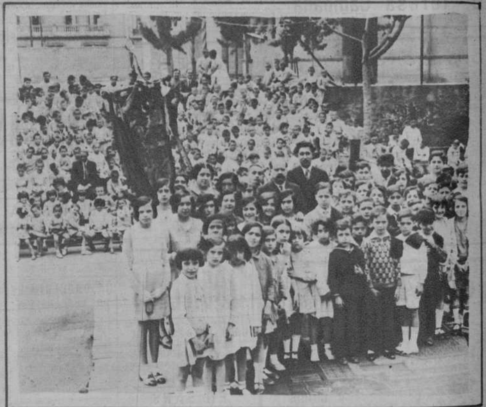
Festival en honor de los niños atendidos por la Junta de Protección a la Infancia. El coro infantil de la «Sociedad Euterpense de los Coros de Clavé», que participó brillantemente.