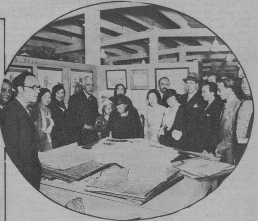
Las autoridades, durante el acto inaugural de la «Feria del Dibujo», instala en los Jardines de Soler y Rovirosa