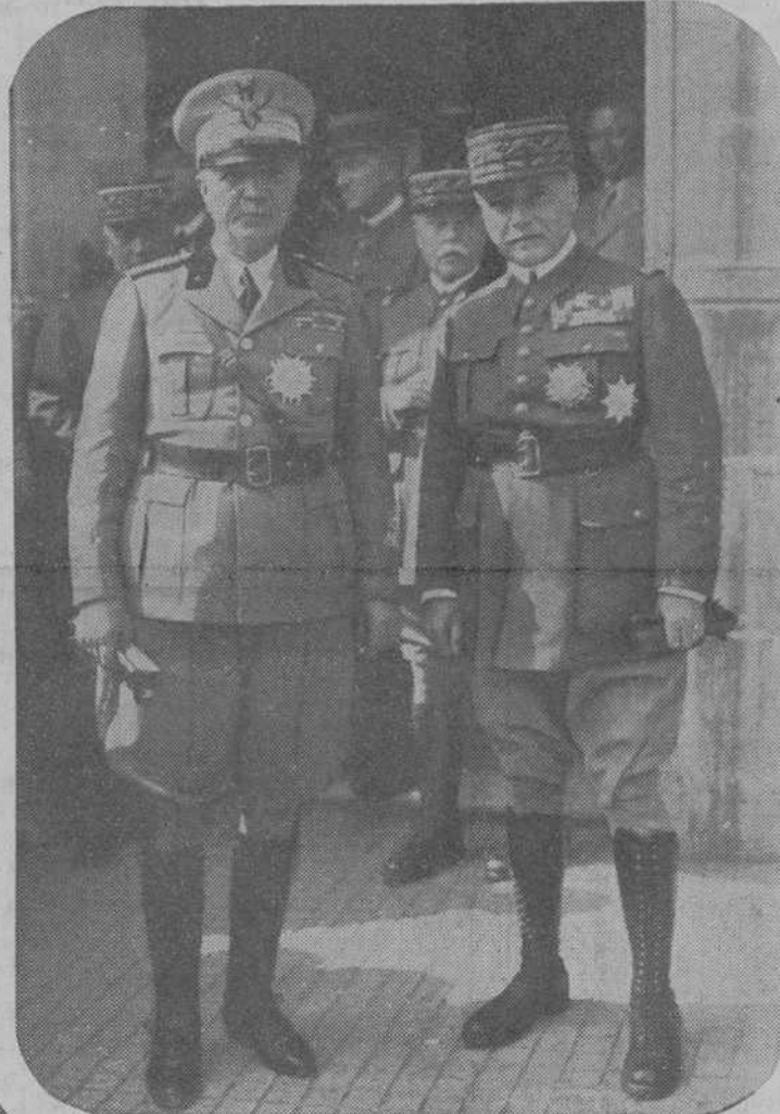
El mariscal italiano Badoglio, y el general francés Menard, retratados durante las recientes maniobras del Ejército francés en Champagne