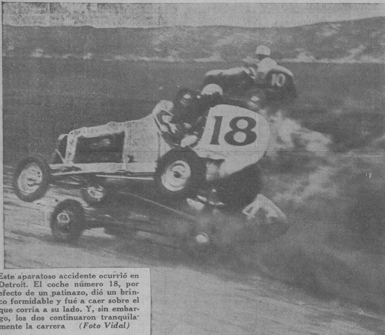
Este aparatoso accidente ocurrió en Detroit. El coche número 18, por efecto de un patinazo, dió un brinco formidable y fué a caer sobre el que corría a su lado. Y, sin embargo, los dos continuaron tranquilamente la carrera