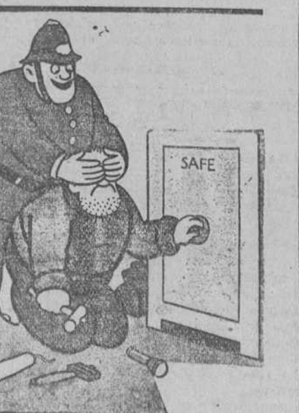
EL GUARDIA.—¿Quién soy? —«Everybody's», Londres.