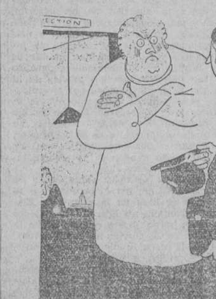
—El dueño de la casa. —Soy yo.

Al efectuar sus compras haga referencia a los anuncios leídos en EL DEBATE