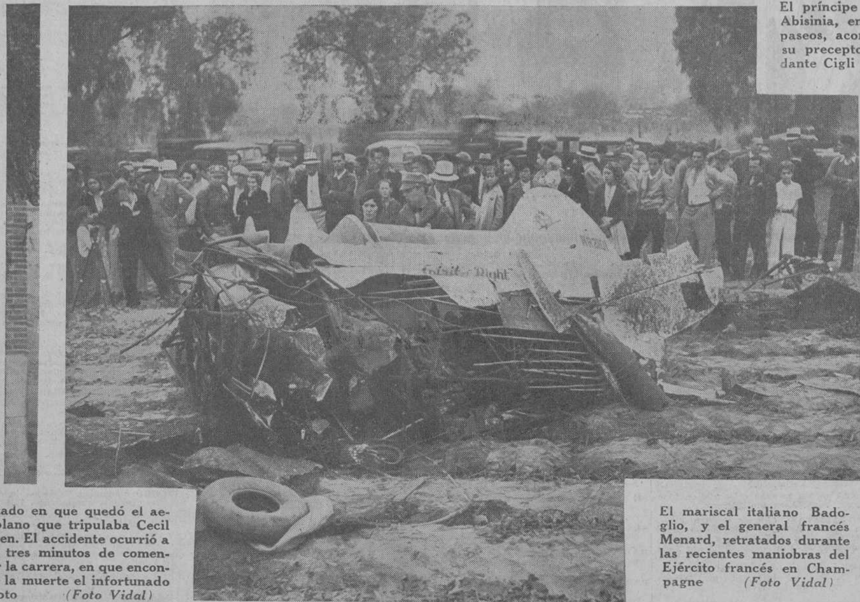
Estado en que quedó el aeroplano que tripulaba Cecil Allen. El accidente ocurrió a los tres minutos de comenzar la carrera, en que encontró la muerte el infortunado piloto