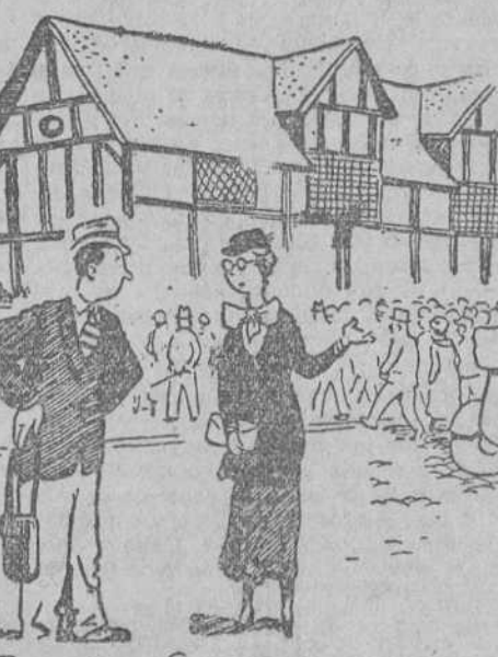
EL GUARDIA.—¿Quién soy? —«Everybody's», Londres.