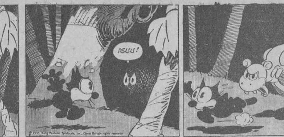
—Imagínese que esta isla ha podido ser la cuna de una raza desaparecida. —Un paseo es lo que ahora procede. —Si ha desaparecido aquella raza, ya sé yo cómo debió de ser.