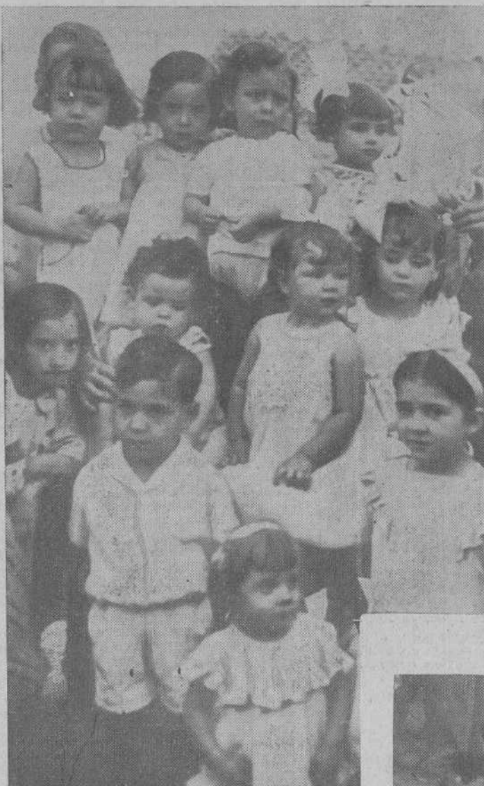
Grupos de niños que han tomado parte en el concurso de belleza infantil, organizado con motivo de la verbena de los barrios Atocha y Delicias

el famoso remedio contra el estreñimiento, de acción natural y no irritante. El Normacol no es un purgante de acción pasajera, sino el verdadero instaurador de la función normal. Es agradable de tomar y no causa nunca molestias. Haga usted un ensayo y comprobará los efectos extraordinarios del NORMACOL