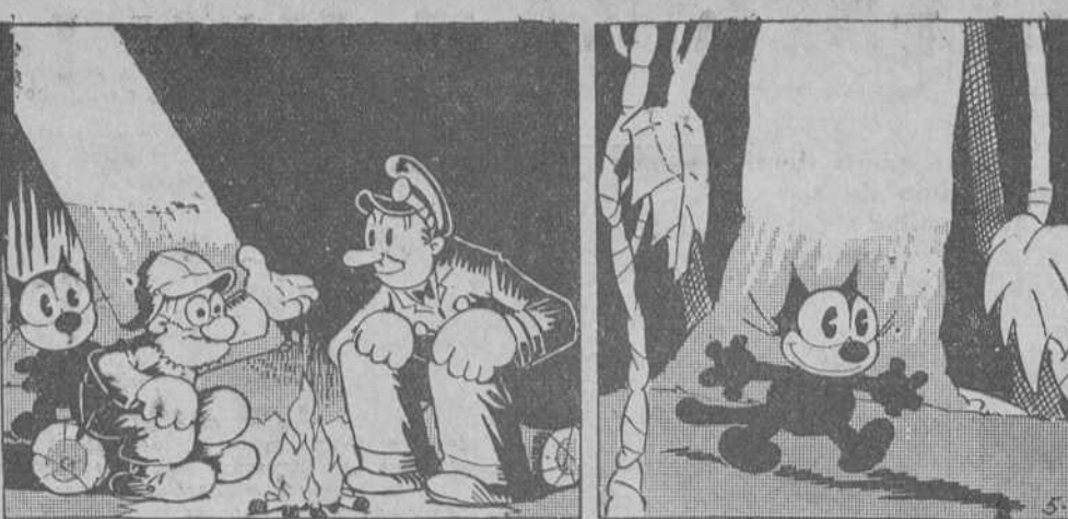
—Imagínese que esta isla ha podido ser la cuna de una raza desaparecida. —Un paseo es lo que ahora procede. —Si ha desaparecido aquella raza, ya sé yo cómo debió de ser.