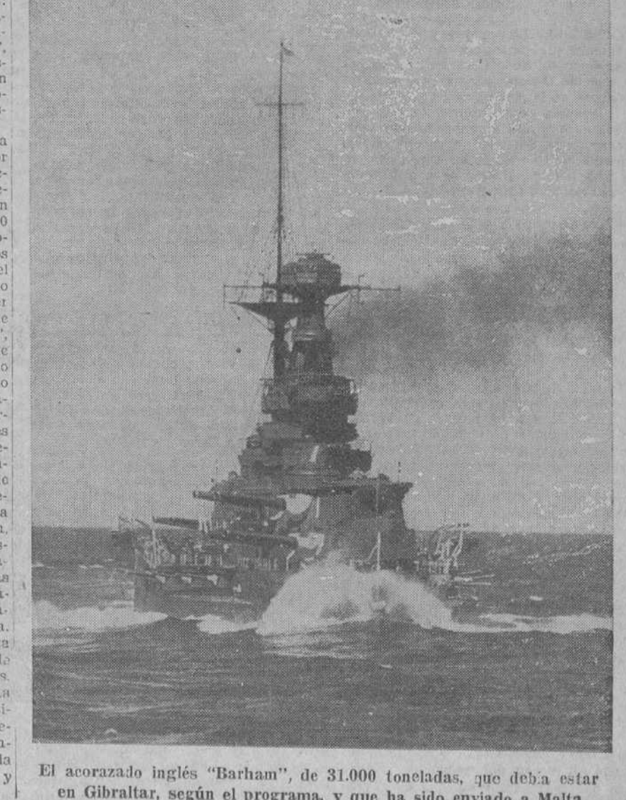
El acorazado inglés "Barham", de 31.000 toneladas, que deba estar en Gibraltar, según el programa, y que ha sido enviado a Malta

Lluvia recogida: La Coruña, 7 milímetros; Santiago, 6; Pontevedra, 1; Gijón, 5; Oviedo, 3; Iguelo, 6; San Sebastián, 7; León, 4; Zamora, 2; Palencia, 2; Burgos, 5; Soria, 4; Valladolid, 1; Segovia, 1; Toledo, 0,2; Cuenca, 2; Vitoria, 12; Logroño, 4; Pamplona, 7,4; Huesca, 3; Gerona, 0,4; Barcelona, 28; Tarragona, 22; Tortosa, 1; Teruel, 1; Castellón, 8; Valencia, 2.