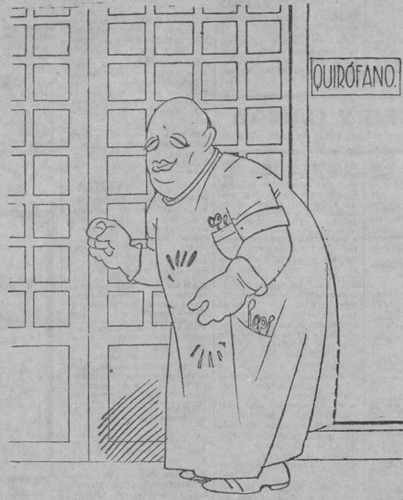
—Ya está; se ha llevado a cabo felizmente.