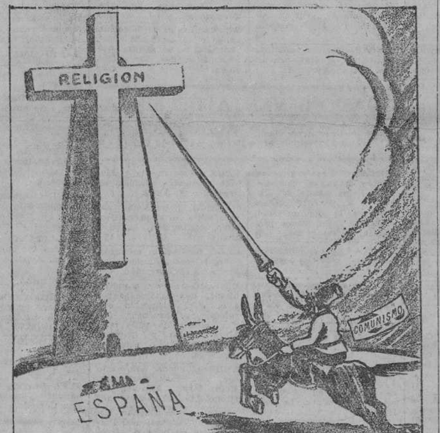
Y en diciendo esto y encomendándose de todo corazón a su señora Dulcinea...

(El Ingenioso Hidalgo Don Quijote de la Mancha, capítulo octavo, primera parte.)