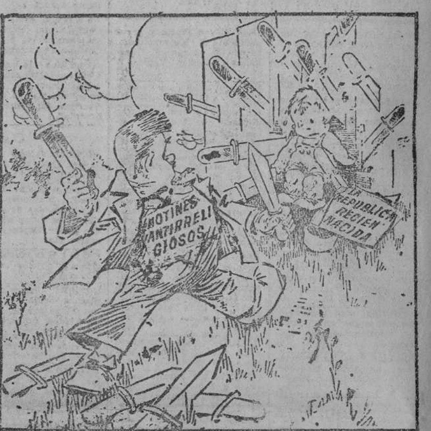
UN JUEGO MUY PELIGROSO ("Philadelphia Inquirer".)