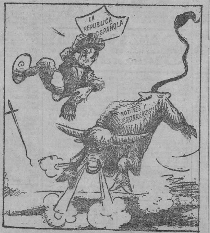
UNA COGIDA AL TORERO NUEVO... ("Brooklyn Times".)

La reproducción del texto cervantino es de la Redacción. El diario norteamericano dice: "Un nuevo Don Quijote lucha contra un molino de viento."