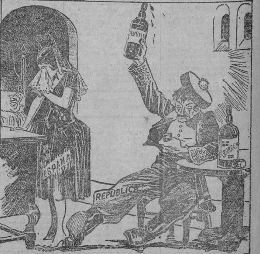
...Y ACABA DE EMPEZAR LA LUNA DE MIEL ("Philadelphia Record".)