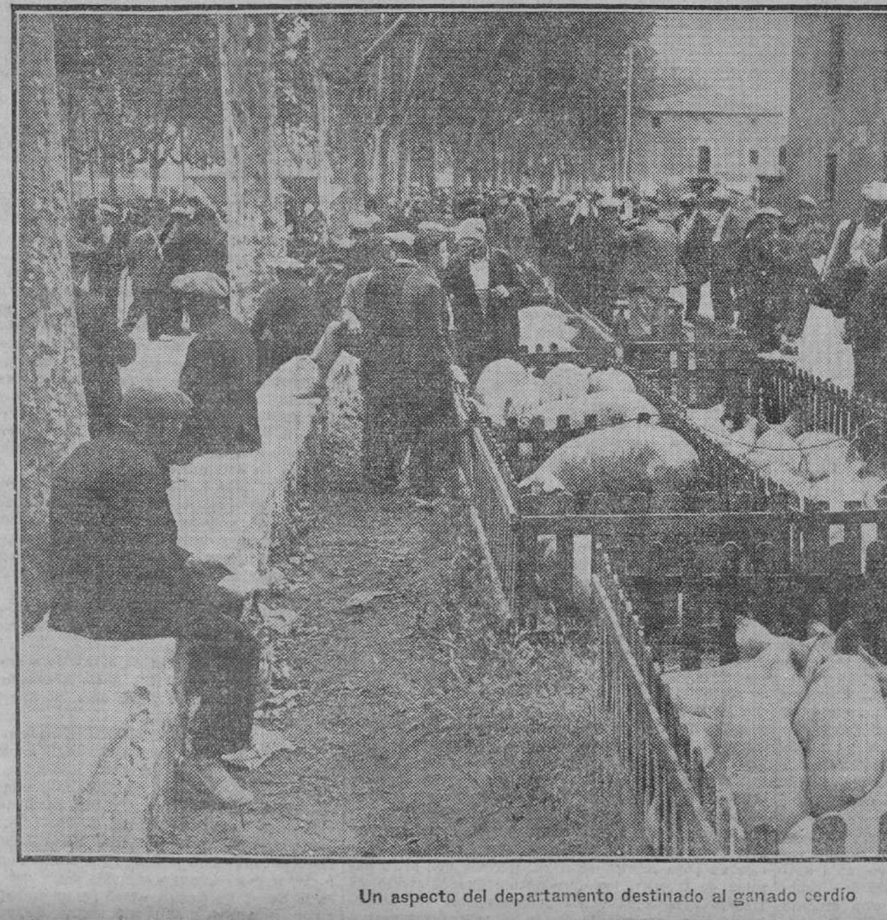
Un aspecto del departamento destinado al ganado cordio