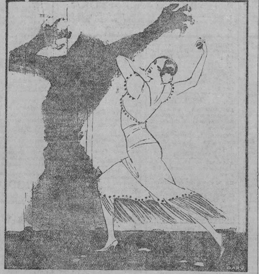
LA DANZA DE LA REVOLUCION ESPAÑOLA ("Kladderadatsch", Berlín.)

Pero otros enjuician la quema de los conventos con criterio social e indican que es el comienzo de la revolución y de la anarquía.