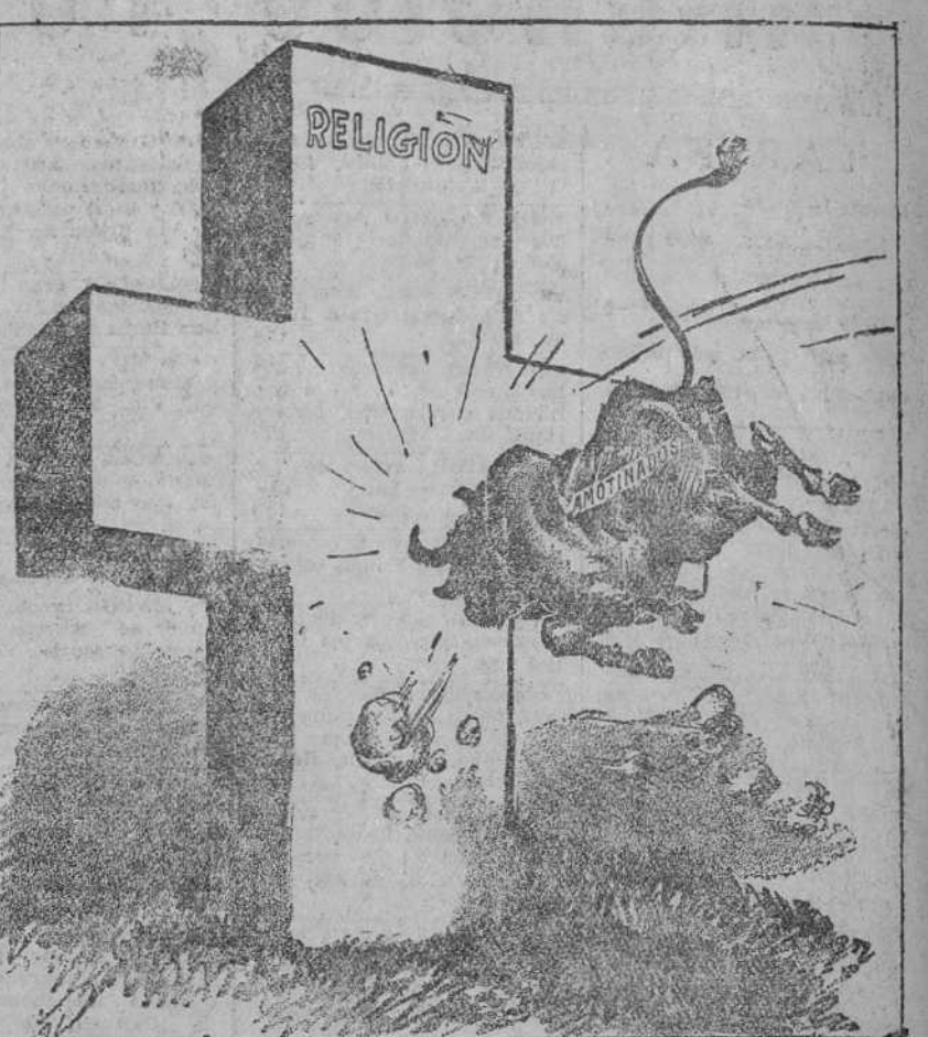
SERA INUTIL ("Boston Traveller".)