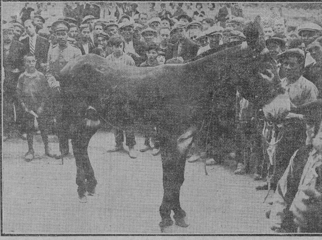
El asno de la raza de garafiones que obtuvo el primer premio