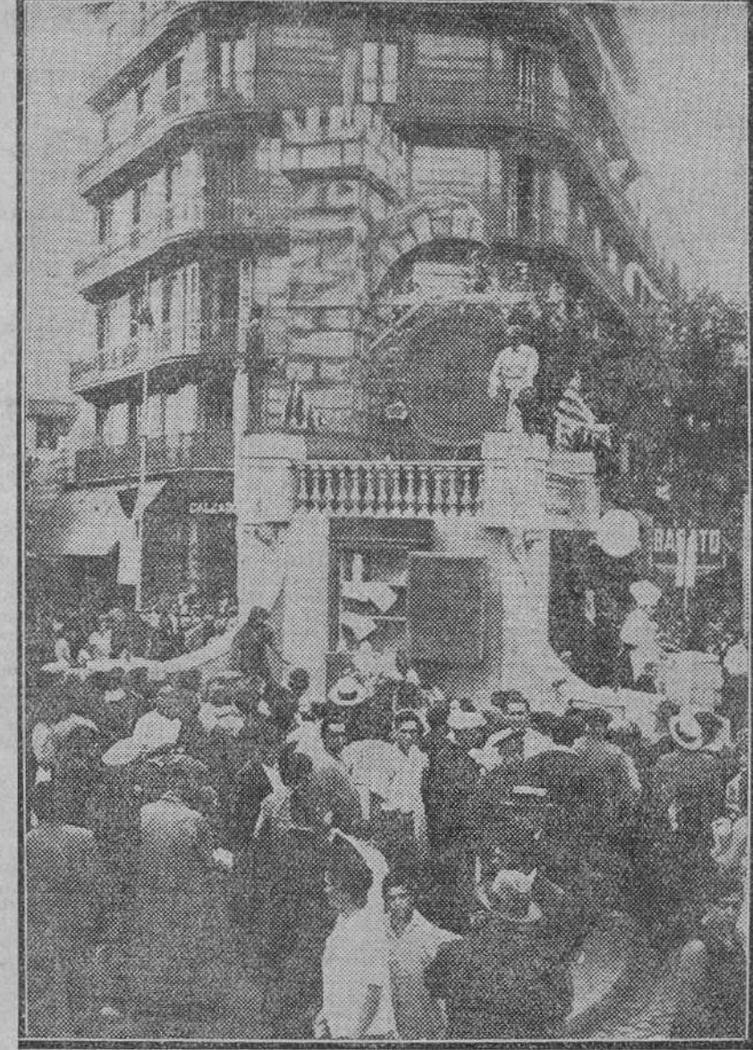
La colonia valenciana celebra en Barcelona las fiestas de San Juan.

La falla levantada en la ronda de San Antonio por el Círculo Valenciano "El Turia"