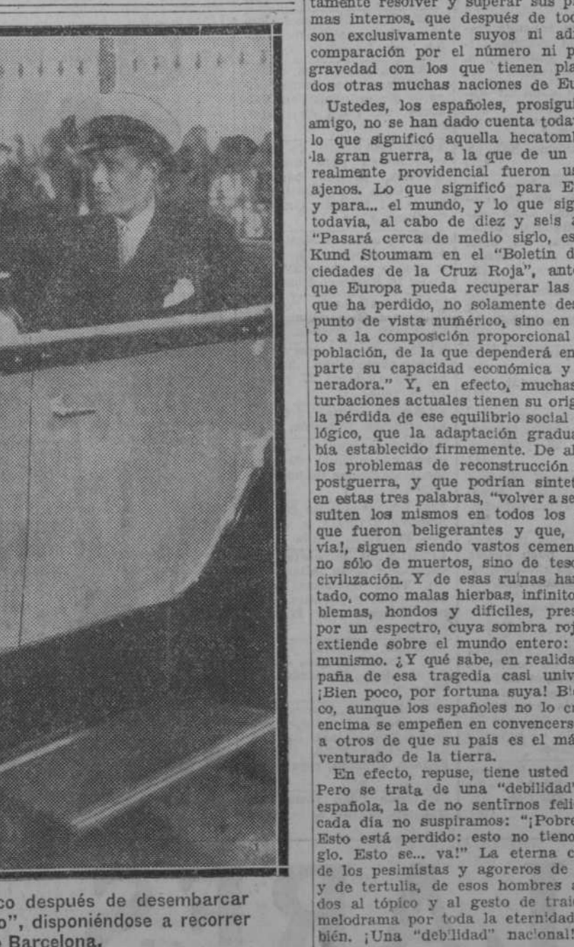
El Príncipe de Asturias, poco después de desembarcar del crucero "Príncipe Alfonso", disponiéndose a recorrer las calles de Barcelona.