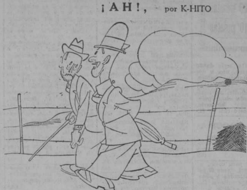
Ni siquiera me explico por qué les llaman liberales históricos. Si, hombre, sí; porque ya pasaron a la historia.