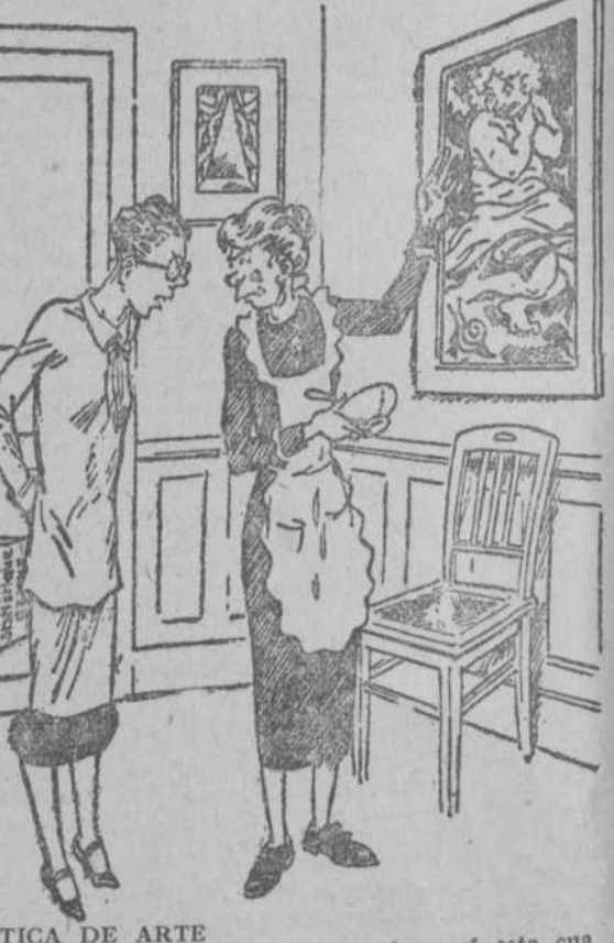
CRITICA DE ARTE —No podría la señorita quitar de aquí este cua dro?... Seguramente es la causa de que se me corra la mayonesa. Dimanche Illustré, París.