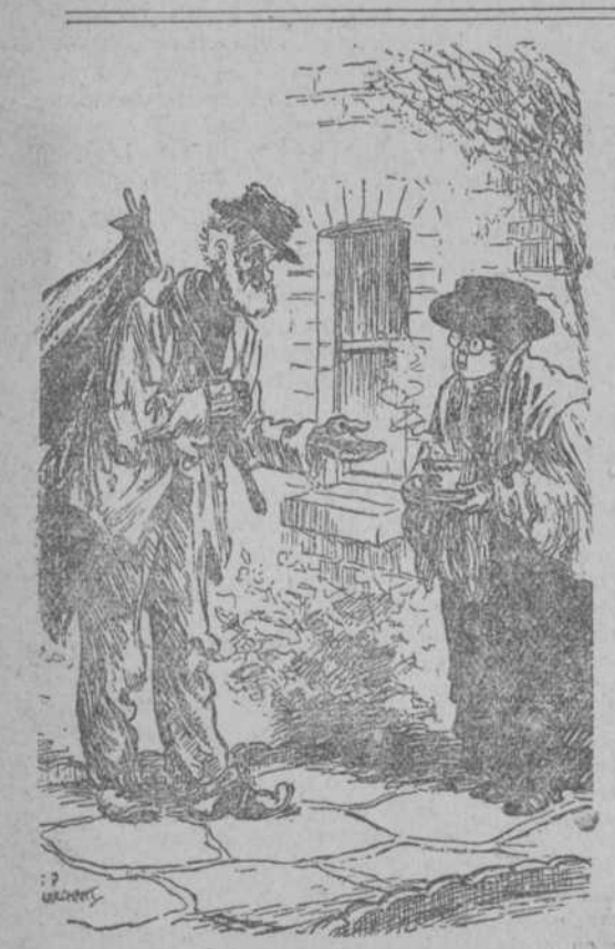
—Y esa tos, buen hombre, ¿la tiene usted mucho tiempo? —Ocho horas diarias; es la jornada. London Opinion, Londres.