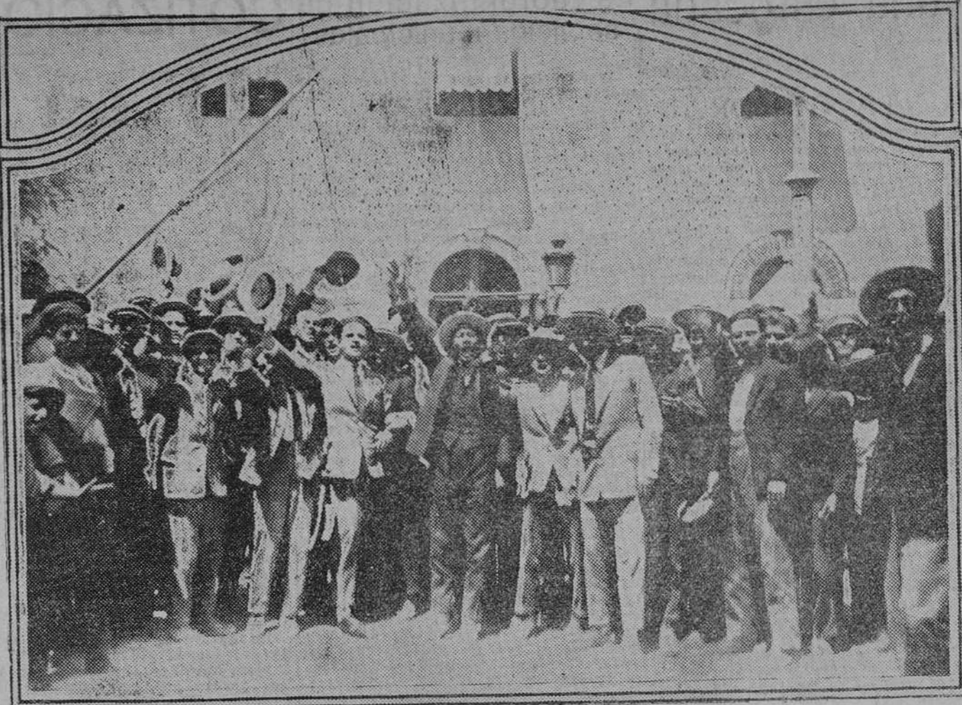
El público adoge con aclamaciones el golpe de Estado