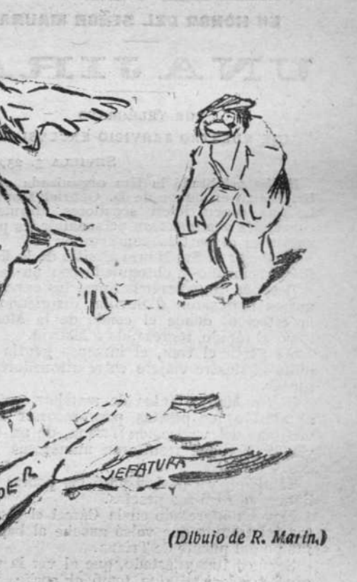
Después del debate.