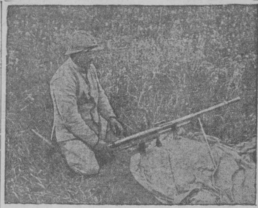
Frete de L'Oise.—Fusil ametralladora instalado en medio de un campo.