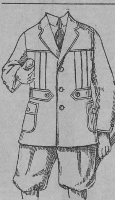
Señor Comerciante del Interior.

De los 230 vestidos que se repartirán el sábado Santo, me reservo unas docenas para los niños y niñas del campo, que vengán a confesar y comulgar el día de la fiesta, juntamente con sus Padres.