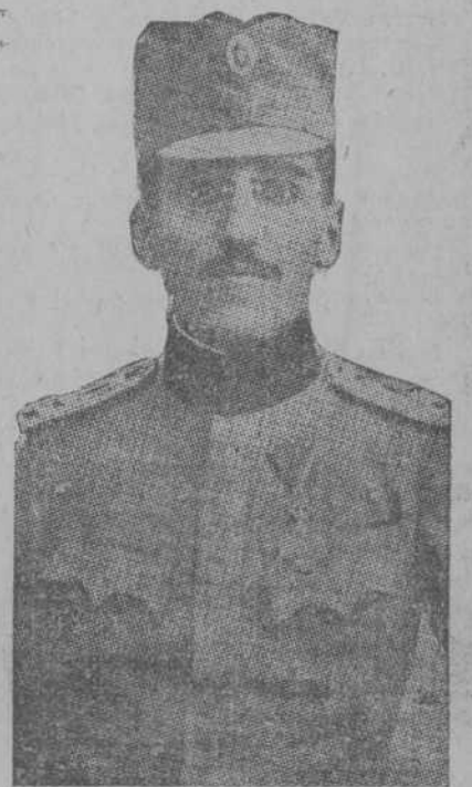
EL PRINCIPE ALEJANDRO, HIJO SEGUNDO DEL REY PEDRO DE SERVIA Y HEREDERO DE LA CORONA

El carácter violento de su hermano Jorge, rebelándose poco menos que contra el Gobierno porque quería a todo trance que se declarase la guerra a Austria, cuando se anexó las provincias de Bosnia y Herzegovina, le abrieron el camino de la Corona.