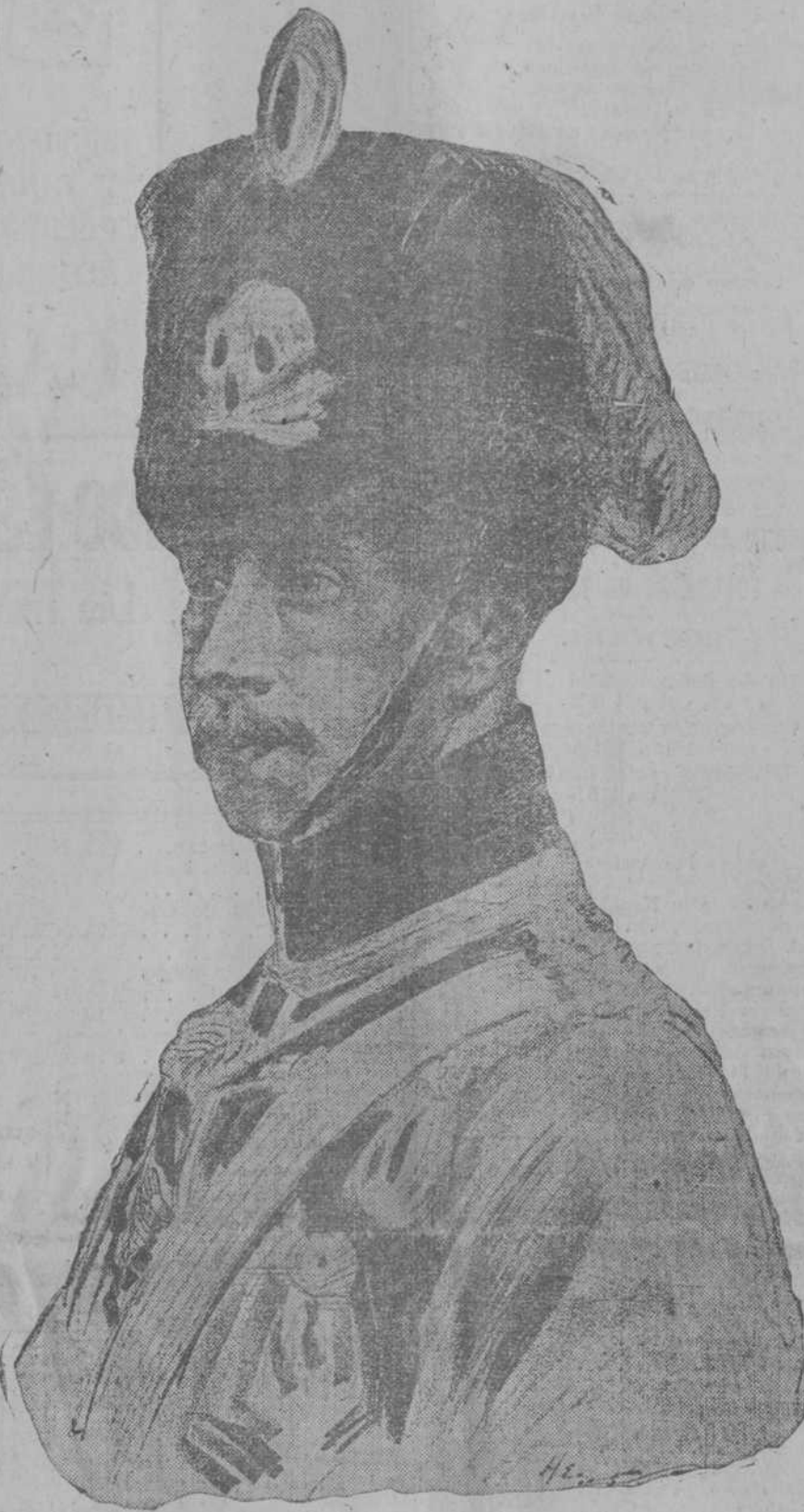
EL KROMPRINZ DE ALEMANIA, FEDERICO GUILLERMO, CUYO ESPIRITU BELICOSO HA PROPORCIONADO AL EMPERADOR GUILLERMO NO POCOS DISGUSTOS

Tiene 32 años y es coronel del regimiento de caballería Husares de la Muerte. El Kaiser teme alguna declaración de su hijo o algún acto violento que ponga en duro aprieto al Gobierno en situación tan delicada como la presente, y de ahí la noticia cableografiada ayer de que lo retenía alejado de Berlín para que siguiese entretenido en jugar a la pelota.