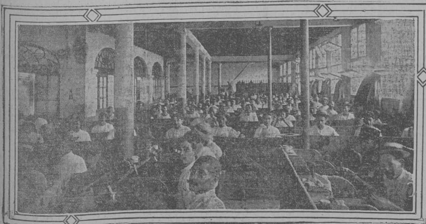
ALA IZQUIERDA DEL TALLER DE ELABORAR TABACO

Por esto, aun a trueque de que se nos tome por "descubridores de me-