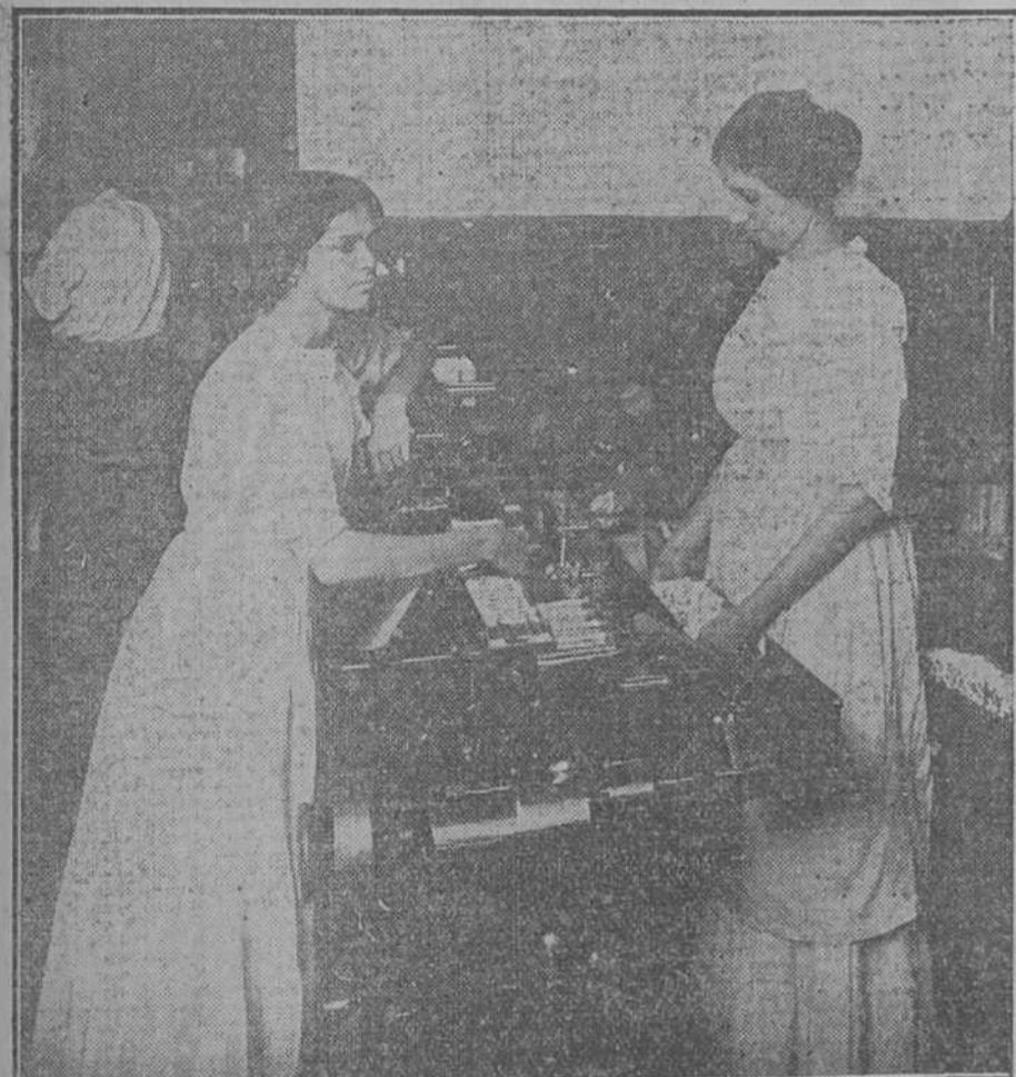
MAQUINA DE EMBOQUILLAR CON BOQUILLA DE CORCHO

pero una visita, como la que la casa diterráneos" emborronamos estas cuartillas y las ilustramos con las fotografías que tomó el amigo extranjero. estímulo y como enaltecedora nota de jero.