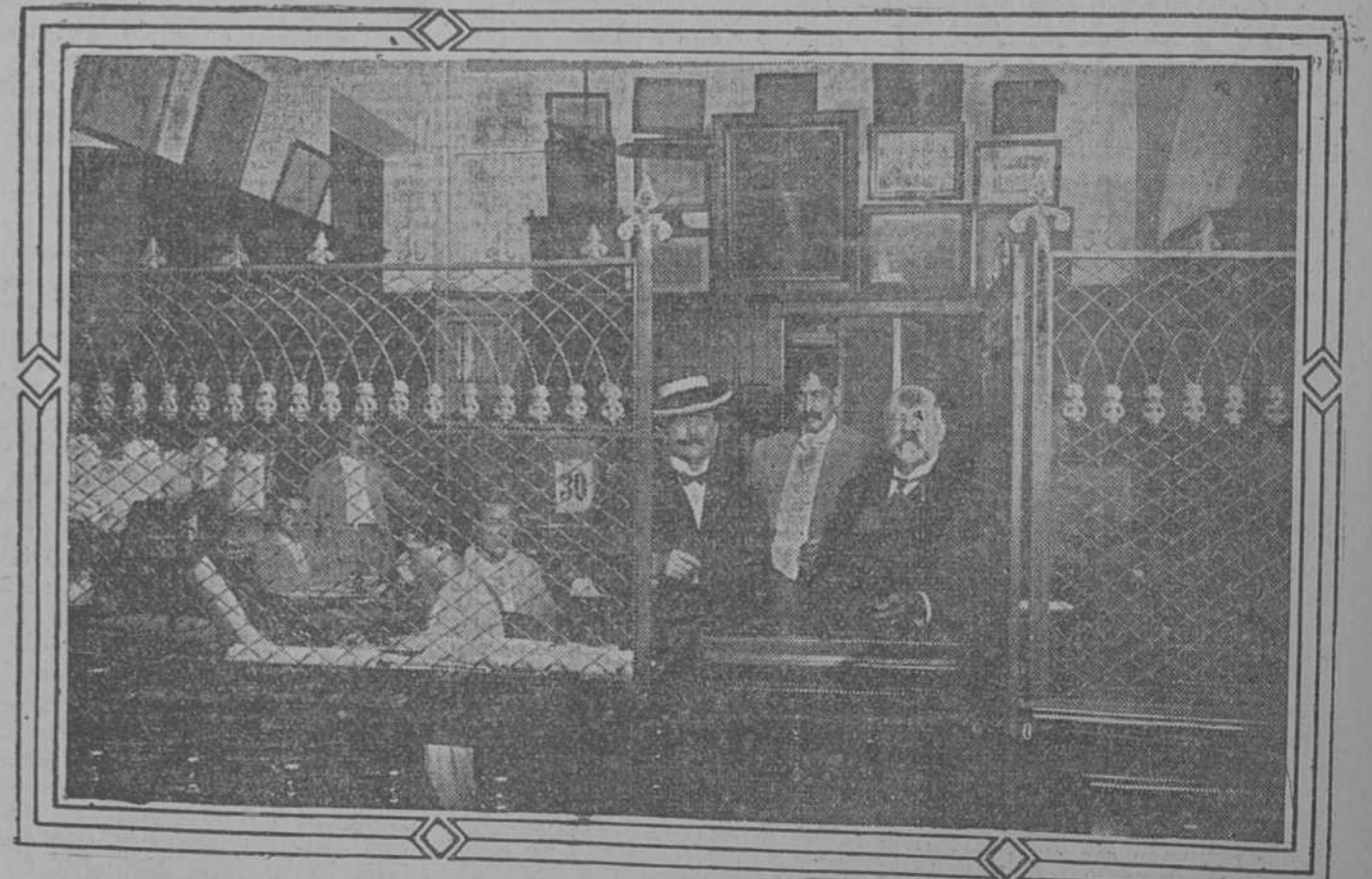
LOS SEÑORES CIFUENTE Y FERNANDEZ Y PERSONAL DE CARPETA