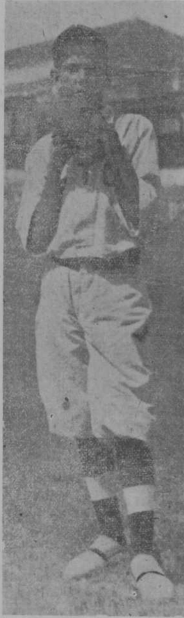
Pitcher del Club "Peñalver"