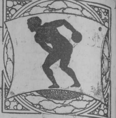
Por Ramón S. de Mendoza