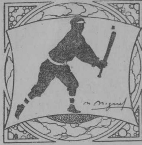
Por M. L. de Linares