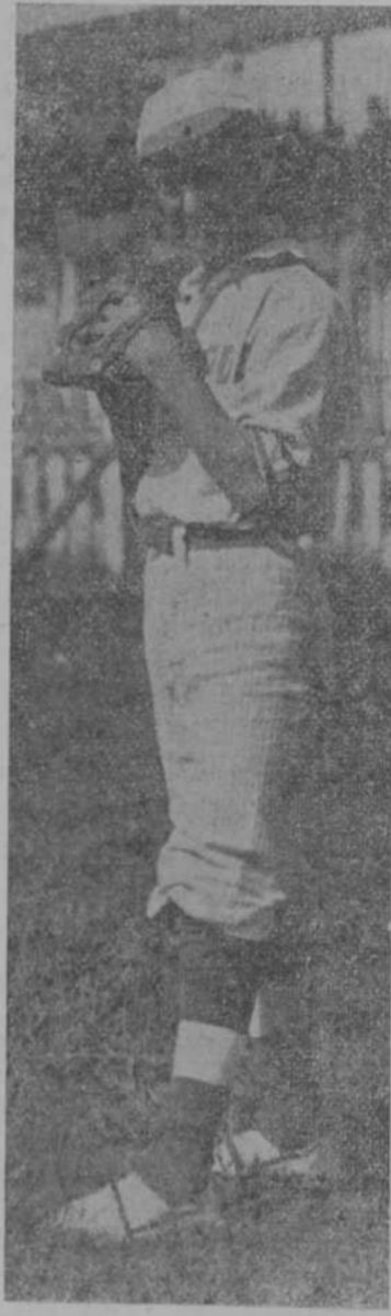
Pitched del club "Moda"