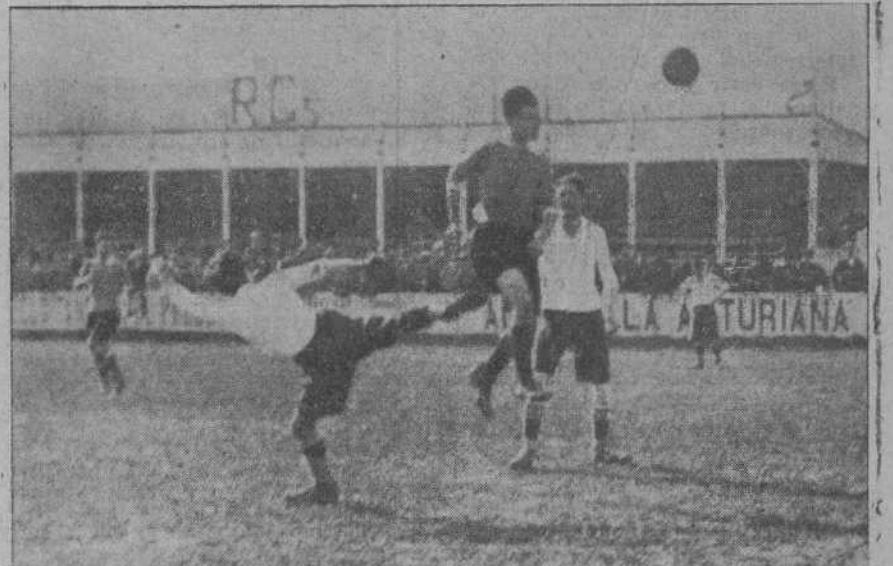
PARTIDO DE CAMPEONATO SERIE B NEW RACING-REINOSA.—Bueno fué el único newracingista que dió muestras de conocimiento y ciencia futbolística, aprovechando juego.

faltan tantas, tantísimas cosas para poder jugar en el partidos de la importancia de los de campeonato, y para que el público pueda acudir a él, no sólo con medianas comodidades, sino sin peligro de salir de allí con una enfermedad que no llevaba al entrar, que creamos sinceramente que la Federación hubiera hecho mejor en no autorizarle, aunque para ello fuera preciso hacer dejación de su sintagmático criterio ampliamente liberal. Hemos hablado al principio del flamante campo de Miramar, pero a decir verdad, se encuentra en tal estado el pedregal, que a nosotros nos dió la sensación de una cosa lamentablemente vieja, algo así como la desgarrada y mugrienta chaqueta que un pobre mendigo herido de algún repavejero que no podía darla ya salida.