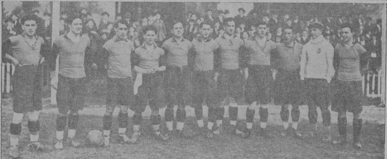
LOS EQUIPOS DE SELECCION VIZCAINA Y ASTURIANA QUE JUEGON EL DOMINGO EN EL CAMPO DE SAN MAMES, DE BILBAO