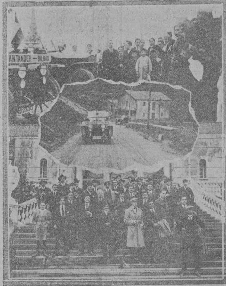
LA LINEA DE AUTOMOVILES SANTANDER-BILBAO.—EL DEAN DE LA CATEDRAL (X) BENDICIENDO LOS AUTOMOVILES ANTES DE LA SALIDA INAUGURAL.—EN PLENA CARRETERA.—LOS INVITADOS DESPUES DEL BANQUETE EN ARCHANDA.