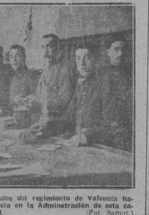
EL CONFLICTO DE CORREOS.—Soldados del regimiento de Valencia...