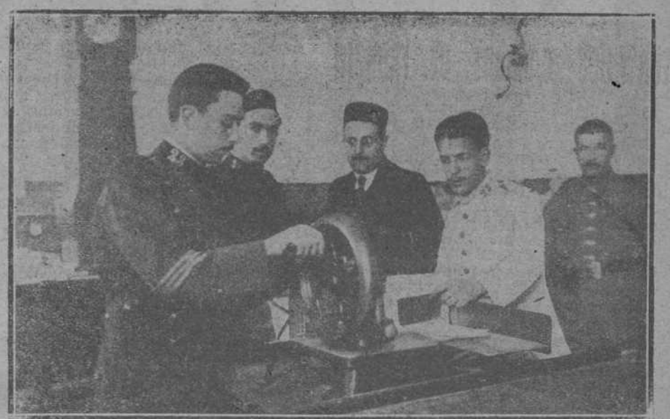
EL CONFLICTO DE CORREOS.—Soldados del regimiento de Valencia...