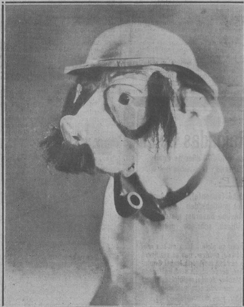
FIGURAS DE LA PANTALLA.—He aquí al popular «Pete», ilustre y «caracterizado» miembro de «La Pandilla». ¿Verdad que muchos señores que presumen de actores cómicos tienen me nos gracia que el perro de Hal Roach?