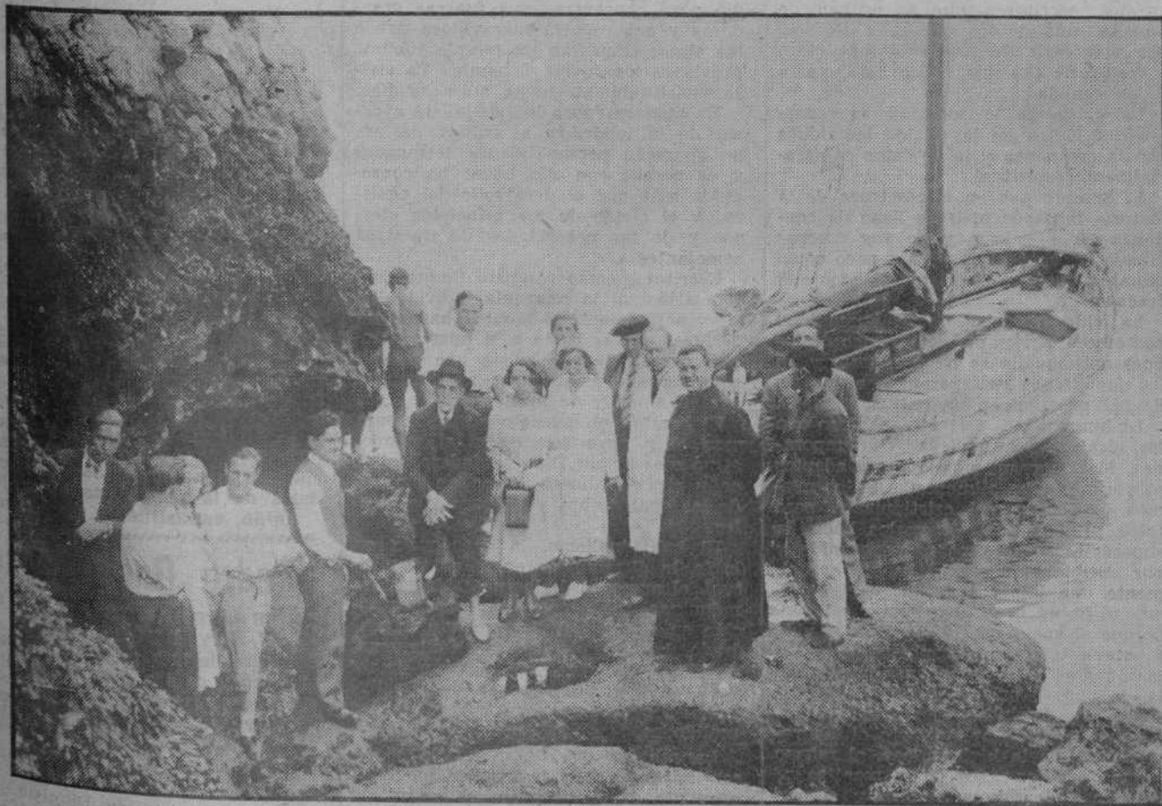
LA CULTURA EN SANTANDER

A esa Estación de Biología Marítima, centro de importantes estudios, en que los organismos oficiales apenas reparan, han acudido estos días numerosos alumnos de la Facultad de Ciencias de Madrid... En esta fotografía aparecen los alumnos con sus profesores, en un viaje de prácticas por la costa.