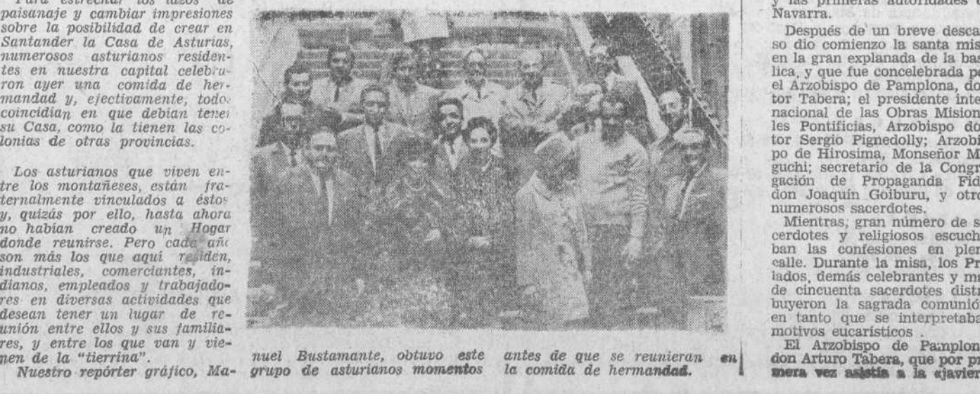
Antes de que se reunieran en la comita de hermandad. Nuestro repórter gráfico, Manuel Bustamante, obtuvo este grupo de asturianos momentos antes de que se reunieran en la comita de hermandad.