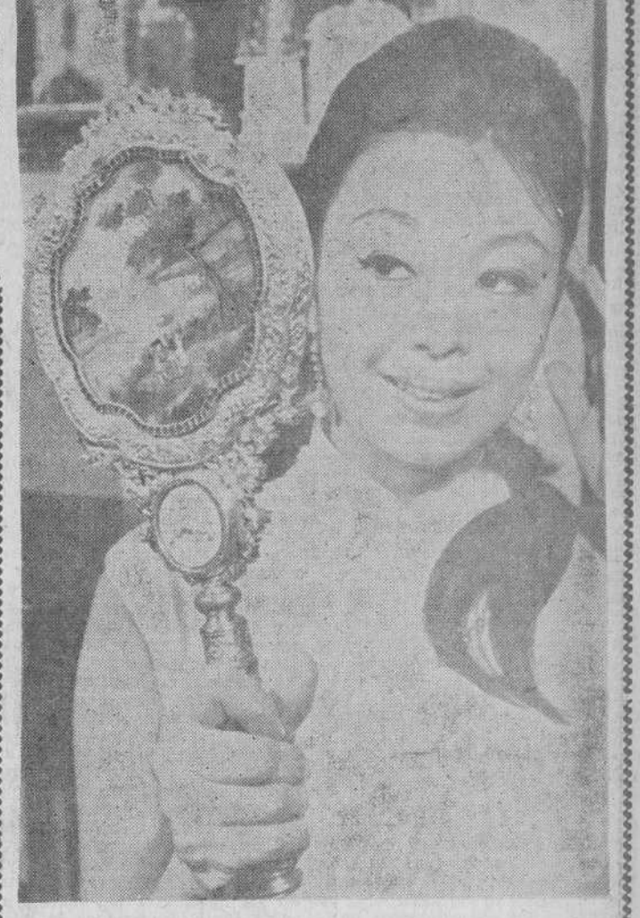
Esta joven china se contempla ante un espejo construido hace doscientos años, obra maestra de orfebrería barroca, ricamente adornado y con reloj incorporado. Esta obra artística fue realizada hacia el 1750, en Londres, por encargo de la Corte china y utilizada por última vez por la Emperatriz Tsu Hsi, apasionada coleccionista de relojes. Mao Tse Tung regaló a un diplomático un reloj de este tipo, que formaba parte de la colección del Palacio de Pekín. El diplomático le regaló después al Museo de Relojes de Wuppertal, en Alemania, donde ahora se conserva.