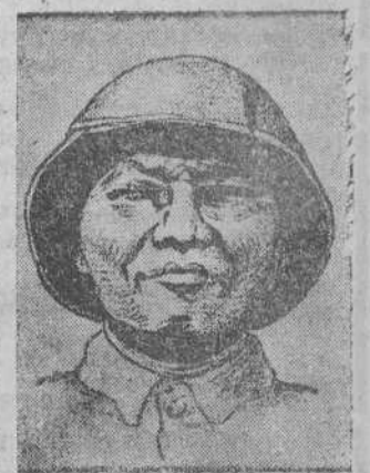
Mao Tse Tung.

Arezzo-Italia.—Las autoridades están investigando las misteriosas muertes registradas en el transcurso de las últimas veinticuatro horas. Las seis muertes se produjeron en un hospital local después de que a los pacientes, niños menores de un año, les hubiera sido practicada una transfusión de sangre. (Efe.)