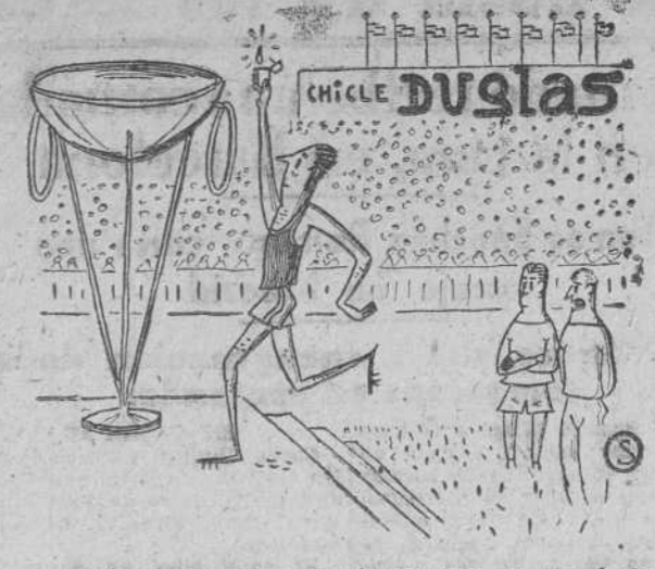
—Son unos juegos tan breves que, en vez de antorcha, usan mechero olímpico...

Emilio Cruz, el primer montañés clasificado, a 5 minutos, 59 segundos del líder