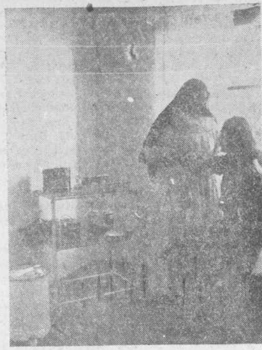
Una asistencia en el Dispensario

Esta es la jaula, alegre, limpia, generosa, de los niños necesitados del barrio de Los Pizarrales, la obra caritativa que ha creado la Caja de Ah-