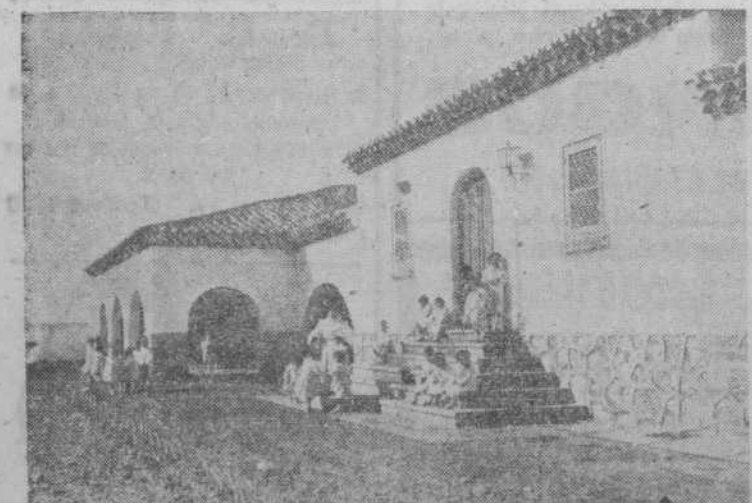
Los niños gozan del sol y el aire