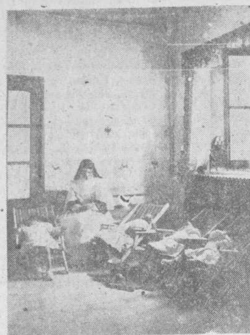
La hora del reposo

Y es un encanto contemplar estas horas. Los niños y niñas llaman a las religiosas que están a su cuidado, se agrupan en torno a ellas y rien alegres, mientras las monjitas les prodigan sus caricias. Así transcurre la mañana para ellos, mientras de las clases llegan las cantineras de los recitados de la lección y las lecciones. Cuando salen al recreo se confunden unos con otros, para formar un espectáculo lleno de ternuras de sana alegría y de extraordinaria paz. Terminada la comida, e