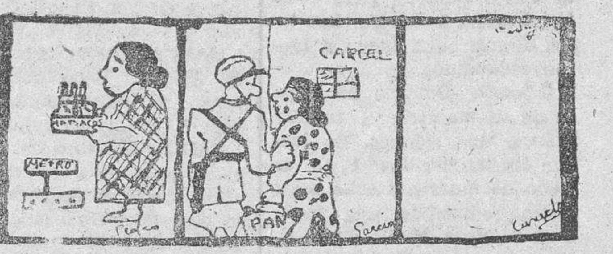
Virginia y Bambú; Internado de señoritas; El hombre invisible